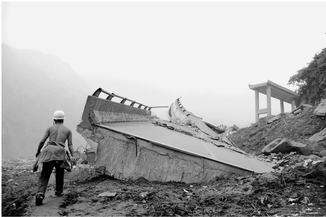
映秀垮塌的公路桥

孩子,孩子们都在哪里?刚刚还尖叫奔跑、拼命呼救的孩子们,怎么一下子就没了声息?一些孩子死去了,另一些还在挣扎着。孤城的心在颤抖,没有了孩子的孤城,还有重生的希望吗?