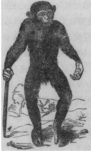
第三图 照泰爱生氏第一图缩写的矮人 Pygmie (1699 年)

泰爱生氏虽于矮人和人的类似点十分明了，但是对于二者间的相异地方，却并未注目。他为总结他的论文，先统计“矮人(Ourangoutang or Pygmie)和人的相似程度胜过和猴(Monkeys)，猿(Apes)的相似程度”的地方共有四十七点。其次又统计有三十四点表明“矮人和人相异和猴、猿相似”的地方。