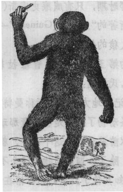
第四图 泰爱生的第二图 矮人 (1699 年)

泰爱生氏把当时关于本问题的参考书籍，十分绵密的检查后，他得到一个结论。就是他所说的矮人 (Pygmie) 和托尔披乌斯氏 (Tulpius) 蓬第乌斯氏 (Bontius) 的‘森林的人 (Orangs)’不同，也不是达普氏 (Dapper) 的 (或宁可