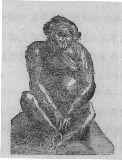
第二图 托尔披乌斯的 Orang 1641.

些动物的知识，带些神秘的色彩。例如蓬第乌斯氏 (Bontius 一六五八) 造成他所称奥兰乌旦 (Orang-outang) 的滑稽而荒唐的图和记事。据他自己说：“这个肖像是根据我亲眼所看见的，(Vidi ego cujus effigiem hic exhibeo)”但是他所说的肖像看第六图霍譬乌斯氏 Hoppius 照原图模写的图 不过象一个体被密毛 容姿可爱的妇人，身体的比例和脚完全和人类一样。英国的优秀解剖学者泰爱生氏 (Tyson) 批评蓬第乌斯氏 (Bontius) 记事道：“我完全不信他的记载”。