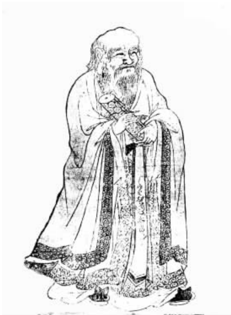
李耳(前 586—?)字伯阳。或作老聃。 楚国苦县(今河南鹿邑)人。哲学家。