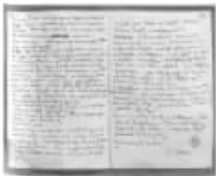
马克思致恩格斯的信函