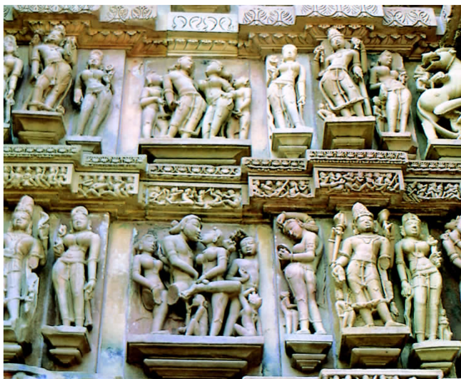
印度克拉久霍石窟，雕刻有大量人体雕像。

释迦牟尼成佛后，首先来到波罗奈城的鹿野苑，向过去跟随他的五个侍者宣说自己获得彻悟的道理。鹿野苑说法是释迦成佛后第一次说法，在佛教史上称为“初转法轮”。这次说法，他阐述人生的苦恼，世事的无常，生死轮回的无穷无尽；分析了人生之所以产生苦恼的原因，证实涅槃寂静境界的奥妙和欢悦，并向他们指出解脱轮回、永离苦海、通往涅槃彼岸的修行之路，这就是佛教所说释迦成佛后“初转法轮”时所宣说的“苦、集、灭、道”四谛之理。五个侍者随即投入佛陀门下，成为佛陀最早的五个弟子。鹿野苑初次说法，侨陈如等五人出家为佛弟子，从此，构成佛教的三个基本要素即佛、法、僧“三宝”具备，佛教正式创立。