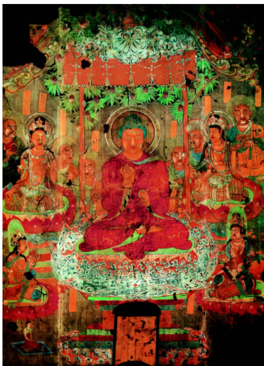
唐代敦煌绢画树下说法图，释迦牟尼结跏坐树下，向两侧的菩萨和弟子说法。

他走到尼连禅河中，一洗六年的积垢，并接受了一个牧女供养的牛奶，慢慢恢复了体力。当时随从他多年的五个侍者见他放弃了苦修，又喝了牧女奉献的牛奶，以为他失去了信心，放弃了努力，感到十分失望，便离开了他。于是他独自一人来到尼连禅河边菩提伽耶附近的一棵菩提树下，面对东方，铺草打坐，并发誓说：