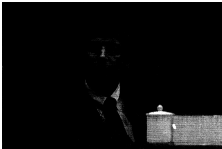
微软帝国至高无上的“皇帝”——比尔·盖茨

盖茨因洞悉未来而毅然放弃唾手可得的 world 名牌大学学位，这种毅然决然非常人所敢所愿的原因，就是他相信自己的智慧之光能驱除明天路上的寒冷和乌云，从而开辟光明温暖的未来！