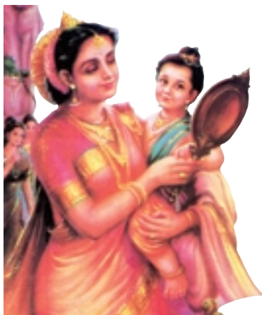
姨母抚育 印度绘画

太子的重任，于是，摩诃公主自然也就代替了她的胞姐，成了加毗罗卫国的又一任王后。对于净饭王来说，悉达多不仅是天神赐给他晚年的一个莫大的幸福，更是释迦族未来的希望所在，是振兴整个加毗罗卫国的希望所在。他希望他的儿子英勇、顽强，希望他的儿子有一国之君的凶狠和残暴。作为一个国王，如果不具备这样的性格，当外敌侵犯的时候，那将是一场莫大的悲剧。然而令净饭王渐感失望的是，在悉达多太子的身上似乎一点也看不到上述的性格。十二岁的孩子，不仅身体看上去相当瘦弱，性格也似乎十分懦弱。一朵白云的飘飞，会让他沉思良久，一只蚂蚁的死亡，也会让他伤心落泪。有时候，当净饭王把在战争中俘获的俘虏分送给将军和大臣们做奴隶时，悉达多会禁不住对