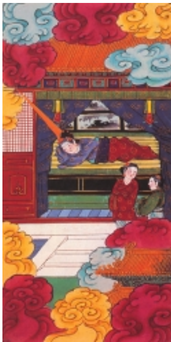
老子托胎图 明代彩绘