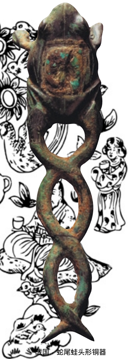
战国 蛇尾蛙头形铜器

大家认为这个建议很好，于是，几个人便蹲在地上画起蛇来。其中有个人很快画好了蛇，正要拿起酒壶喝酒的时候，他看到其他人还在手忙脚乱地画着，于是，便自作聪明地用左手端着酒壶，右手在地上为蛇画起了脚。这时，另一个人已经画好了蛇，他毫不客气地夺过酒壶，说：“蛇本来没有脚，你为什么要给它添上脚呢？”说完，他端起酒壶，大口大口地喝了起来。而原来那个为蛇添脚的人，已经后悔不已，只得在一旁吞口水了。