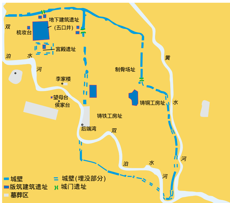
郑国故城遗址分布图