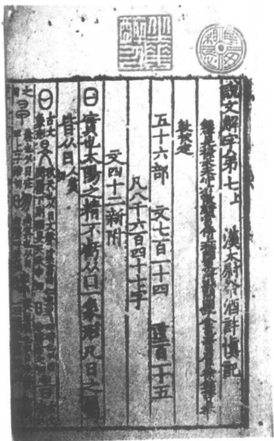
汉许慎《说文解字》，宋刊小行本