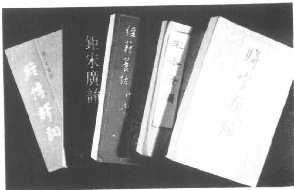
1949年以来，大陆彩印、出版的部分古文字学著作。