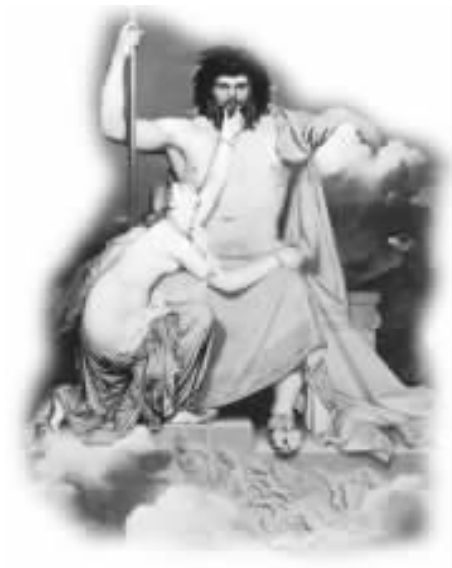
法国画家安格尔1811年的名画《宙斯与忒提斯》

话说阿喀琉斯知道瘟疫由来之后,就逼阿伽门农放弃克律塞伊斯,哪里知道阿伽门农却要拿阿喀琉斯掳得的美女布里塞伊斯(Briseis)作交换,于是好色的统帅就和好色的大将起了严重冲突。阿喀琉斯不仅罢战,还请母亲忒提斯向宙斯请愿,让希腊联军打几次败仗,以证明没有阿喀琉斯,希腊联军就成不了气候。法国著名画家安格尔(Jean Auguste Dominique Ingres, 1780—1867),有多幅和特洛伊战争有关的名作,公元1811年完成的帆布油画《宙斯和忒提斯》( Zeus and Thetis )就把阿喀琉斯母亲向宙斯撒娇求情的一幕,栩栩如生地表现了出来。