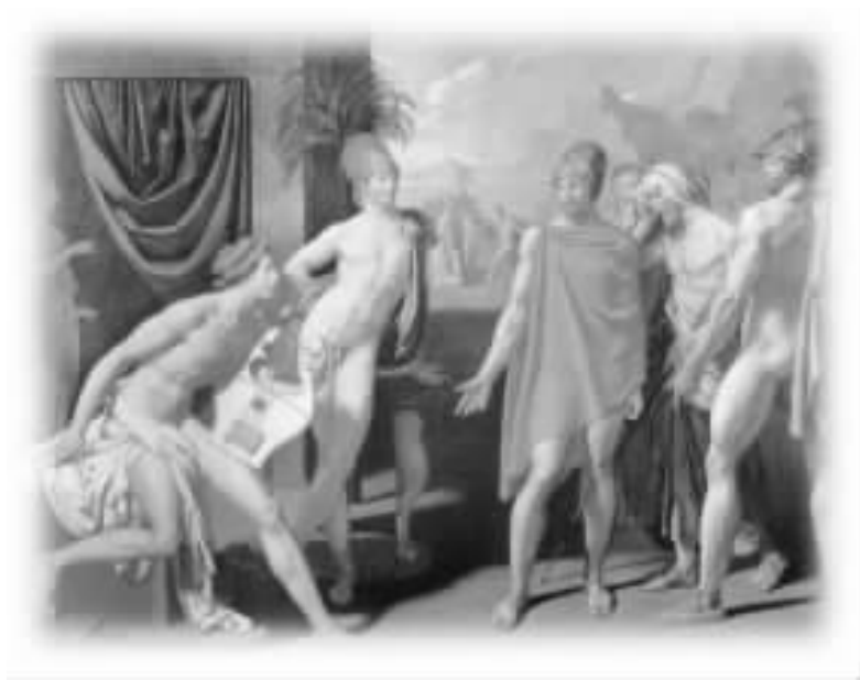
《阿喀琉斯营帐中的阿伽门农使者》

阿伽门农为了证明没有阿喀琉斯,希腊联军仍是可以打胜仗,因而下了总攻击令,哪知却被特洛伊守军打个大败,整个阵线退了几公里。阿伽门农知道非靠阿喀琉斯出战不可,于是派了使者前往阿喀琉斯营帐协商,请求阿喀琉斯息怒。安格尔也凭其想像力,在公元 1801 年完成了帆布油画《阿喀琉斯营帐中的阿伽门农使者》( The Ambassadors of Agamemnon in the Tent of Achilles ) ,图中左方的阿喀琉斯一副太平模样,弹琴作乐不理世事,图中右方的阿伽门农使者奥德修斯,则极力晓以大义,希望阿喀琉斯尽弃前嫌出战。