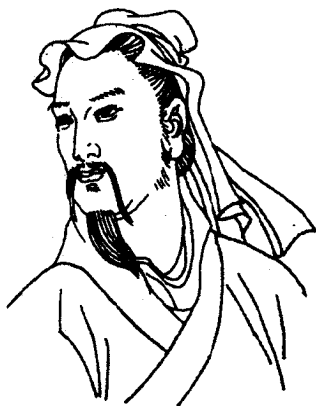
王叔和 公元 180 - 270) 魏晋著名医学家