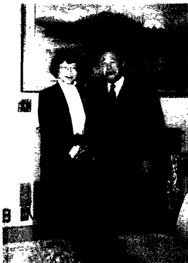
贾蕙董和田中角荣