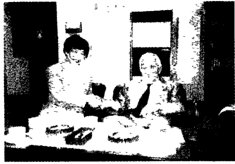
右为宇都宮徳馬, 左为贾蕙莹

Q: 宇都宮徳馬さんの対中友好は主にどういった方面で行われたのですか？具体的にお話いただけますか？