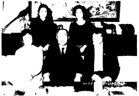
在田中角栄家中，中为田中角荣，右为贾蕙萱