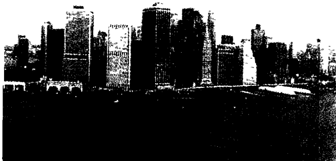
图为遗迹位置所在的曼哈顿地区。◎摄于去年11月。

怀特海德代表指出,他们将把纪念馆设计成像华盛顿市内的林肯纪念馆那样外观十分美丽的建筑。