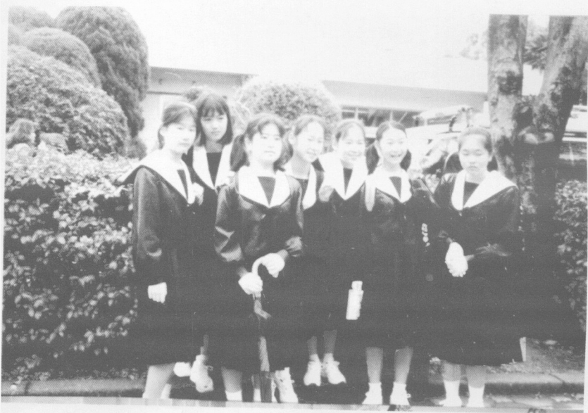
セーラー ふく 服 女中学生制服