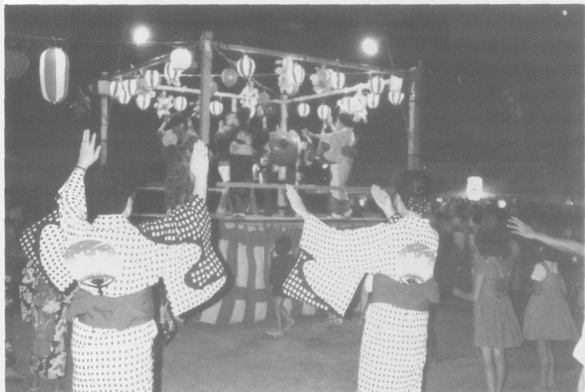
はちがつ ほんおど 八月のお盆踊り 八月的“盂兰盆会”舞蹈