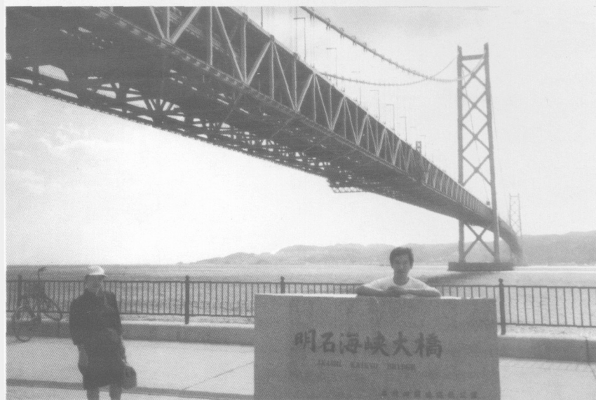
あかし かいきょう おおほし にほん いち 明石 海峡 大橋 日本一 连接本州与四国的日本第一大跨海峡大桥