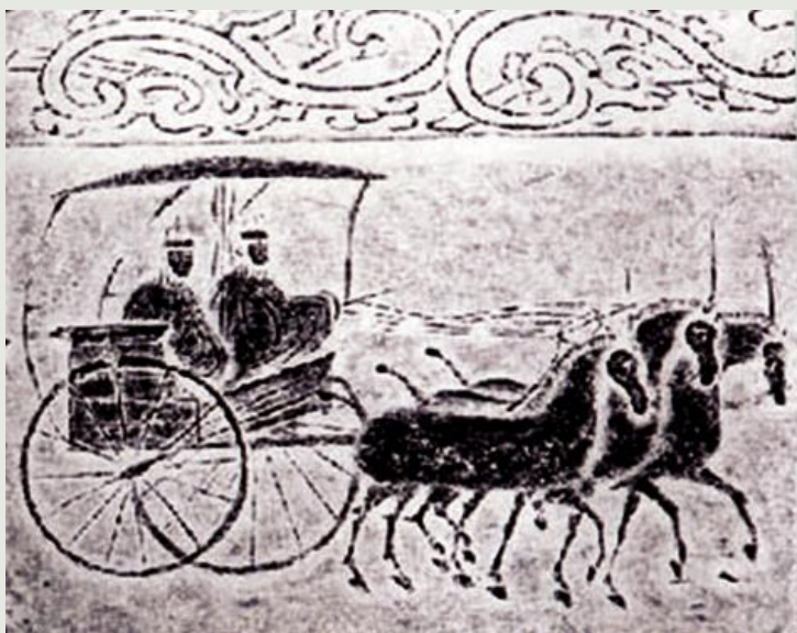
东汉“轺四骏驾”画像砖(1955年四川成都新繁清白乡一号墓出土，现藏于四川省博物馆)

颜斶，齐国人，是齐宣王时期著名的稷下先生、思想家。有一次，齐宣王接见颜斶的时候，颜斶直言不讳的谏说齐宣王要“贵士”，他旁征博引，用大量的历史事实和理论分析，充分论证了士人，即知识分子在治国中的重要地位和作用。古代的贤明君主，之所以贤明，就是因为他们“得贵士之力”。颜斶认为，士所以比君更为宝贵，就在于他们是君主治国安民的决定因素，王侯是依赖那些有才能的士人辅佐，才能成就功业。就当时来说，齐宣王要达到王天下的目的，就必须破除“王贵”思想，树立“贵士”观念，否则将一事无成。从而使齐宣王真正认识到士人的价值和作