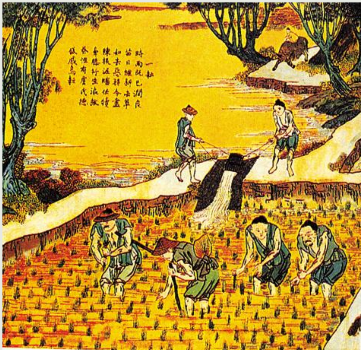
反映我国古代农民田间劳作的《耕织图》之一。1988年,康熙命焦秉贞据宋代楼寿《耕织图》重新绘制。

孟子借用这个故事, 向他的学生说明: 违反事物发展的客观规律而主观地急躁冒进, 就