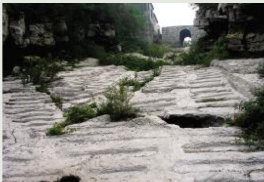
青石关北关门北侧关沟古道

儿说，又名兒说，因其能言善辩，而“辩”与“说”同义，又作“兒辩”、“貌辩”，因其久居齐国，所以又有“齐貌辩”之称。他是战国时期宋国人，游于稷下，为早期名家学者，也是著