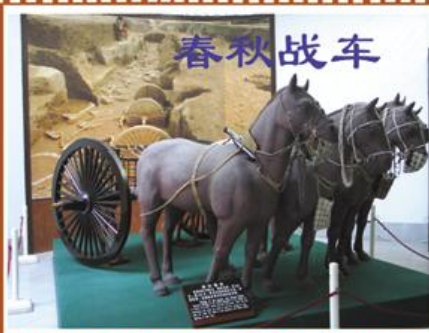
古车演进图 据临淄中国古车博物馆陈列