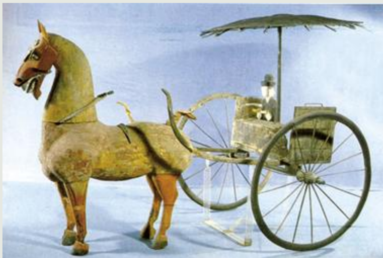
东汉木雕车马俑 1972年出土于甘肃武威,是迄今为止发现的最大的汉代木雕作品,藏于甘肃省博物馆。

齐宣王听了颜斶的进谏,知道颜斶是个人才,就对他说道:“只要你愿意出来做官,就请先生到我这儿来住,咱们一同生活,一块游玩,我保证您每顿饭都有肉吃,出门有车坐,给您的夫人和孩子穿上漂亮的衣服,让您一家人享受荣华富贵,怎么样?”颜斶不愿意做官,听了宣王的话,就回答说:“晚食以当肉,安步以当车,无罪以当贵,清静贞正以自娱。”意思是说,吃不起肉,就推迟吃饭时间,等饿厉害了再吃就好比吃肉一样香了;没有车坐,步行时只要走的安稳些,就好比坐车一样舒服了;当老百姓,只要不做坏事不犯罪,清白正直,就比升官发财还自在。”颜斶表示自己做到尽忠直言就