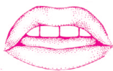
不振动发出 /I/ 音

将舌尖放在前部的上下齿之间,几乎碰到牙齿,气流从齿舌间冲出,发出声音。声带震动发出 /J/ 音,不振动发出 /I/ 音。