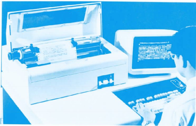
图 1-4 1978 年东芝公司展出的文字处理机

人们一直没有停止汉字处理系统的研发，1978 年能够进行假名、汉字转换的“文字处理机”（word process）问世（见图 1-4）。自此认为汉字没有效率、不能适应时代要求的前提已经失去，关于文字改革的争论也就自然告一段落。