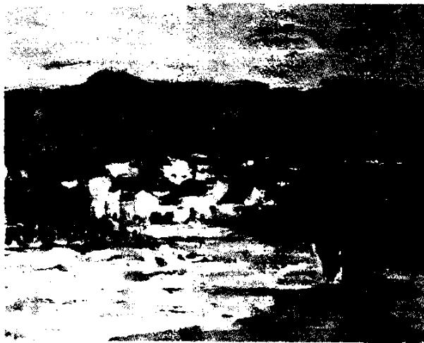
史国强 / 日暮屏山

与“大汉”一样，“山东好汉”也是对山东男人的一种褒称。自古以来，齐鲁之地的山东人就给人以勇而好斗的印象，这大概与农民起义有关。山东是农民起义较多的地区，自秦末到清末，这里发生的农民起义举不胜举，而小说《水浒传》与《说唐》正是在这些农民起义的基础上成书的。因为有了这样的小说，人们一提到山东人，总会将山东人与“山东好汉”、“梁山好汉”联系在一起，于是乎，“好汉”几乎成为山东人尤其是山东男人的代名词，他们也以此种称呼为荣，当然山东男人也不愧此称。电视剧《水浒》中的主题歌中有这样的歌词：“路见不