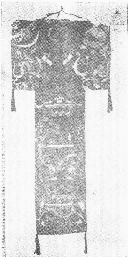
1. 西汉 马王堆一号汉墓帛画