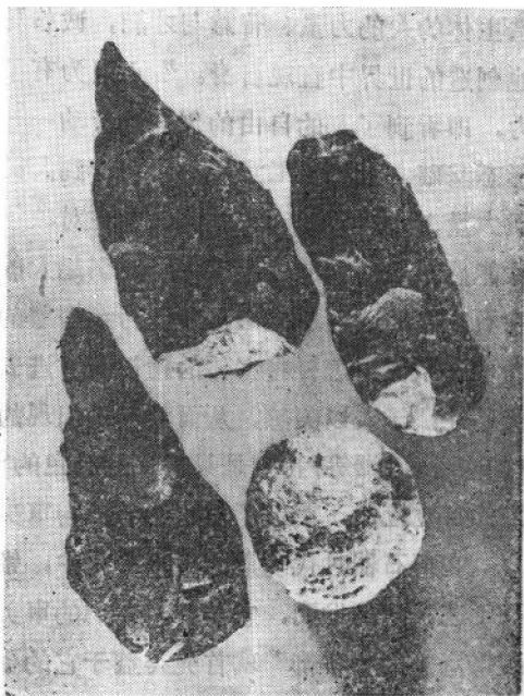
图1 旧石器时代丁村文化石器

所未有的。根据著名考古学家贾兰坡先生的研究和推断，这些石球（数量约1500枚）是属于狩猎用的武器。它的出现，既是一个应用的过程，即人们在长期的狩猎实践中发现：圆形的石头在投掷时较之不规则的块状石头更易于准确迅速地击中目标，也是