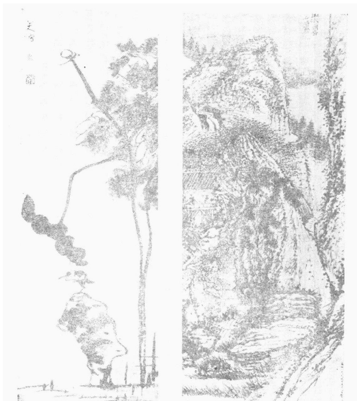
4. 清 朱安《荷花水鸟图轴》 清 石涛《山水清音图》