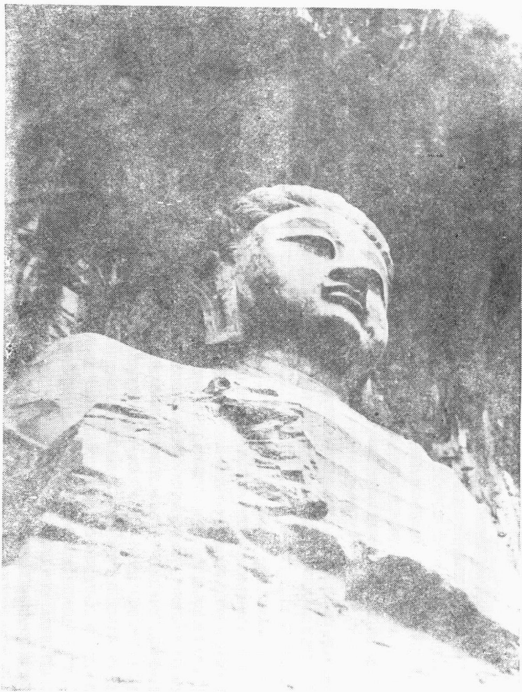
2. 唐 龙门石窟奉先寺卢舍那佛像