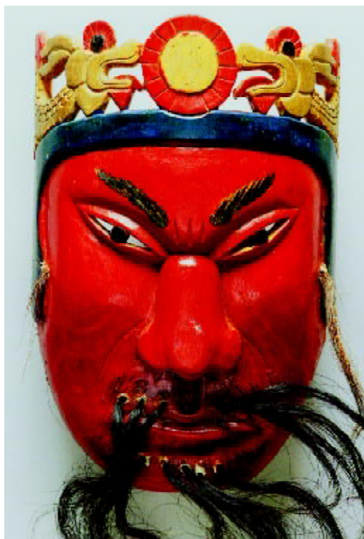
图 1-11 四川土家族阳戏面具“关公”

器时代仰韶文化马家窑类型的典型代表之一。其主体纹饰是五人一组，手拉手，面向一致的人物形象(图1-7)。靳之林先生从民俗、民艺和考古学角度，考证这个彩陶上的“舞蹈”纹样，就是黄河流域大量的作为镇邪驱灾的“五道娃娃”和“拉手娃娃”巫俗剪纸的原型(图1-8)。并且此类剪纸现在仍然作为护佑生命的巫术在民间广泛使用(靳之林《抓髻娃娃》)。公元8世纪安史之乱，杜甫由长安向北仓皇出逃，夜宿陕西白水县彭衙时，友人为他濯足解乏、剪纸招魂。杜甫在《彭衙行》中有：“暖汤濯我足，剪纸招我魂。”这也是中国民间艺术作为古老巫俗实现的例证。