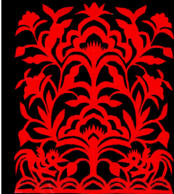
图 1-5 陕西旬邑库淑兰“生命树”剪纸