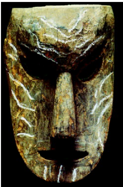
图 1-10 贵州彝族“撮泰吉”面具“阿安”