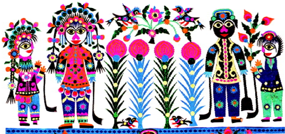
图 1-17 库淑兰创造的彩色剪纸“禁烟歌”

拼贴剪纸,并用它营造了无比绚烂丰富的艺术世界,这是只有真正艺术大师才有的天才创造。而这位不足一米五的小脚大娘却经历了不幸婚姻、丧子、坠崖甚至是受尽虐待的生活,而她却顽强地活下来并充满希望地用剪刀创造着属于她自己的精神世界,她说自己就是神一样尊贵的“剪花娘子”,剪纸成为她的神圣使命。写不出名字的她,能记住上百首当地民歌和大量的民间故事,并通过剪刀表现出来,传统剪纸中的古老纹样,被库淑兰赋予了新的生命。库淑兰被联合国教科文组织命名为剪纸大师,而她的生活并没有多少改变,直至故去(图1-17至图1-19)。同库淑兰大娘经历相似的还有已故的张林召、王兰畔、阎喜芳等一大批默默无闻的民间艺术家群体,她们是当之无愧的民间艺术大师。生活的极度清贫和苦难与民间艺术创作的极度灿烂成为鲜明的对比,她们