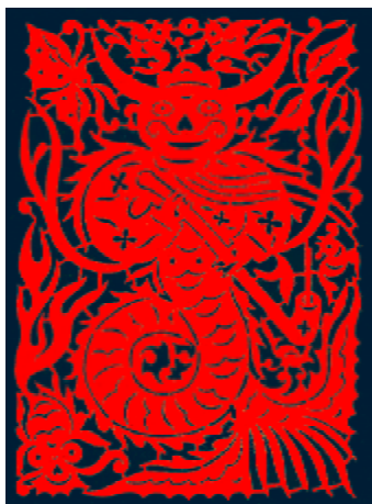
图1-14 贵州苗族龙纹剪纸