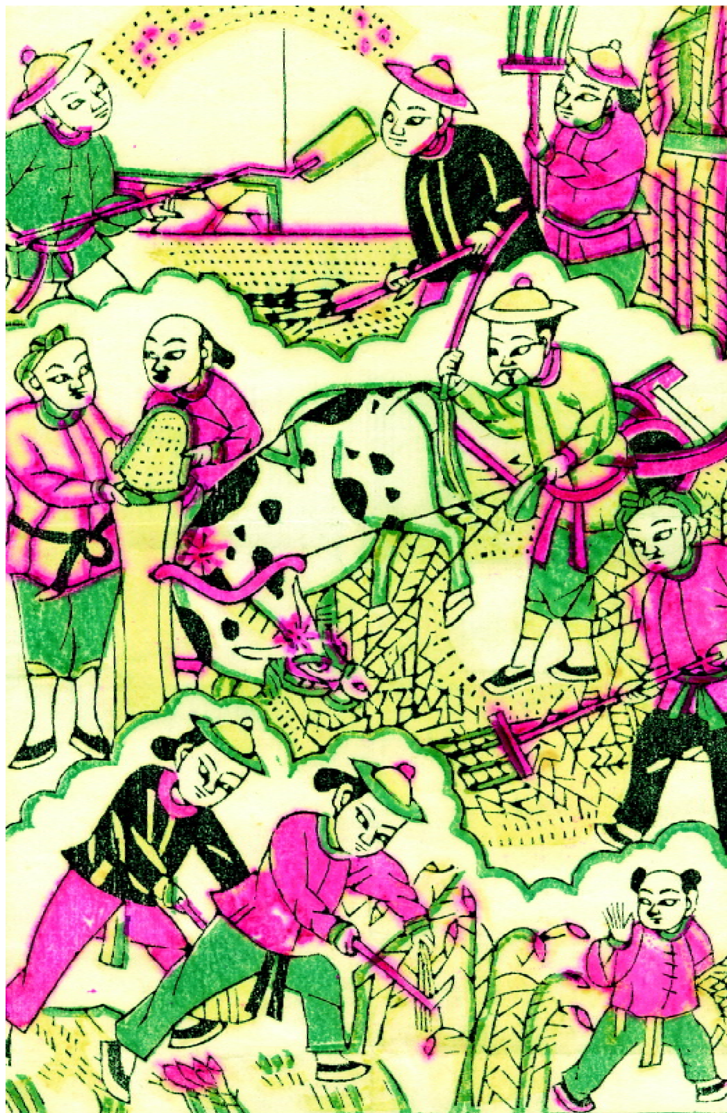
图1-2 陕西凤祥木版年画“男十忙”