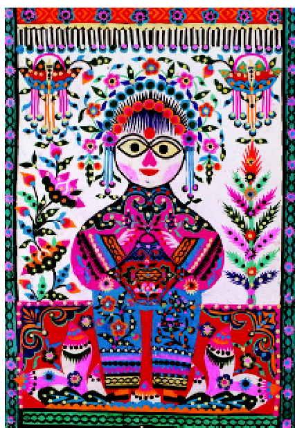
图 1-18 库淑兰创造的彩色剪纸“剪花娘子”