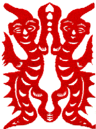
图1-13 甘肃陇东地区的人面独角龙剪纸