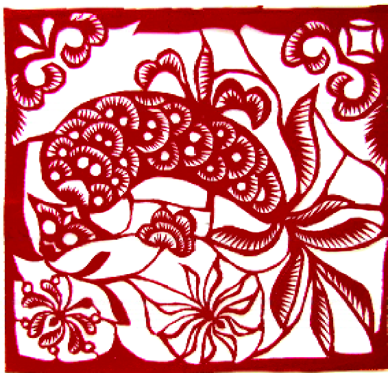
图 1-9 陕北地区传统的“鱼戏莲”剪纸