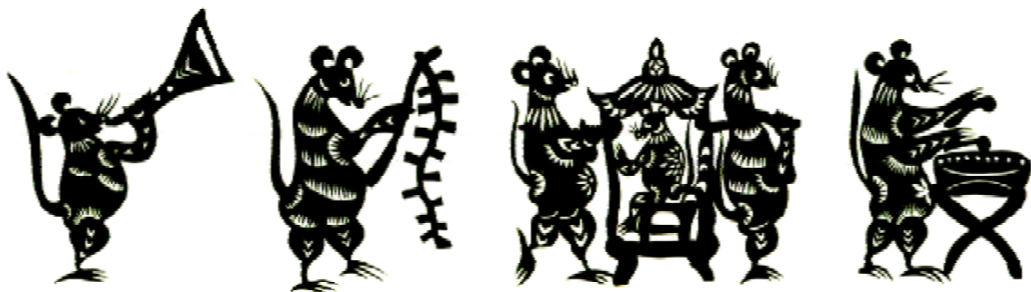
图1-3 安徽阜阳程建礼“老鼠嫁女”剪纸

当我们欣赏丰富多彩的民间艺术品时,常常会发现绝大多数民间艺术品的内容相同,如广泛流行于汉族农耕地区的《老鼠嫁女》题材,虽然地域相距千里,但内容几乎完全一致(图1-3)。实际上这并不奇怪,因为它从来就不是个体艺术家的发明创造,民间艺术样式的背后有着深厚的习俗文化传统,有广大民众群体的生活习俗和群体意识,狭义的艺术概念无法体现民间艺术的真正魅力。我们的目光应投向创作者和传承者群体的生活,关注民间美术产生的乡村田野,关注创造、传承群体的观念意识。只有如此才能更客观地解读中国民间美术,这一为生活而创造的群体艺术。