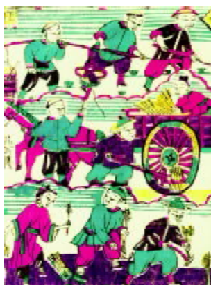
图 1-1 山东潍坊杨家埠木版年画“男十忙”局部

中国民间美术的主体是反映广大民众在习俗生活中最基本的群体意识。在中国传统农耕文化的生存环境中,生存与繁衍是最基本的群体意识,也就是中国民间美术的生命主题。而作为源远流长的民族文化的潜流,中国民间美术沉淀、叠加了自早期文化以来大量的民族文化信息,形成了中国特有的造型观念与符号体系,从而成为中国各民族的艺术母体,同时也是不同族群地域文化的重要标志。这是中国民间美术的主要文化特征(图 1-1、1-2)。