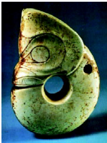
图1-12 东北红山文化的“猪龙”玉器

形象的描绘，体现出不同的地域特点。在西南苗族文化发祥地是牛龙合一的“牛头龙”；在东南沿海古越文化区是鸟龙合一的“鸟头龙”；在西北羌文化发祥地是虎龙合一的“虎头龙”、“独角龙”；在东北的红山文化发祥地是猪龙合一的“猪头龙”（图1-12至图1-14）。不同民族服饰艺术多半会成为记述本民族标志和历史的载体，如苗族的刺绣服饰，就是一部穿在身上的史书，它记录了丰富古老的苗族历史文化信息。其中有苗族图腾祖先载体——由枫树变成的蝴蝶妈妈，大洪水过后姜央兄妹合磨成亲繁衍人类，有姜央射日等神话故事等。陕北及陇东地区作为皇帝族肇兴之地，体现其图腾崇拜的“龟蛇鱼蛙”大量出现；还有体现北方游牧文化的马具艺术纹饰（图1-15）、南方的傩戏仪式中的面具艺术、