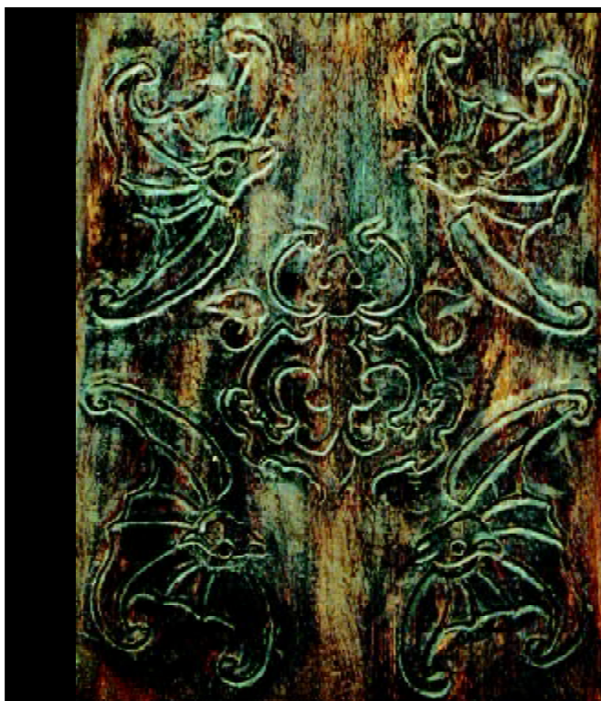
图 1-4 山西晋中民居木雕“五福”