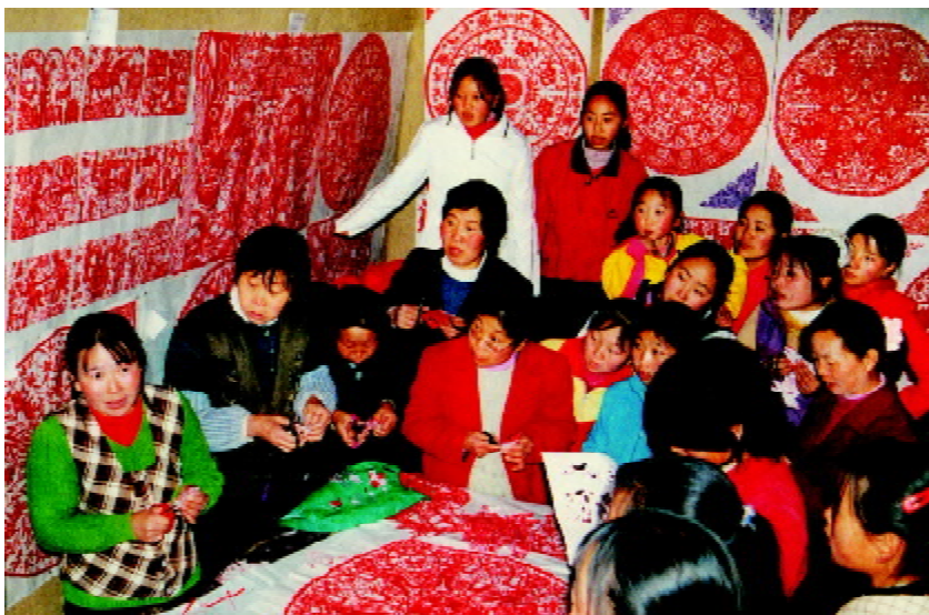
图 1-16 陕北延川小程村劳动妇女进行民间剪纸创作

中国民间美术的创造者是普普通通的生产劳动者群体,其中既有从事农业生产的民间“巧手”,也有脱离或半脱离农业生产的民间艺人。在中国几千年来的自然经济为主体的社会中,形成了“男耕女织”的社会分工,家务劳动和民俗文化活动则主要是由妇女主持。许多农村劳动妇女,成为了民间美术作品的主要创造者(图1-16)。她们通过最简单的劳动工具,最易得易取的生活材料世代相沿着民族文化传统,在传承中不断丰富和创新,创造了富有民族和乡土特色的优美艺术形式。