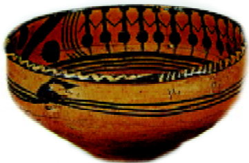
图 1-7 青海大通上孙家寨出土的“舞蹈纹彩陶盆”

作为四大文明古国之一，中国文明的持久性与连续性，在世界文明史中是独一无二的。“文明”与“文字”关系紧密，但一种文明的持久性延续，我们不能只关注文字对文明的记录、传播和发展所起的作用。五千年的农耕文明延续至今，由自然环境、生产生活方式、族群相对稳定的聚居关系所固定下来的许多古老习俗传统，同样是中华文明持续发展的重要因素。它比“文字”记录的中华文明史更加古老、更加丰富，是中国文明发展不曾间断的深厚文化潜流。中国民间美术所体现的就是“非文字”的古老习俗文化传统。它记录了自早期多源文化以来不曾间断的最普遍、最本源的文化信息和生存智慧，并且在中国传统民俗生活中生生不息地传承着。