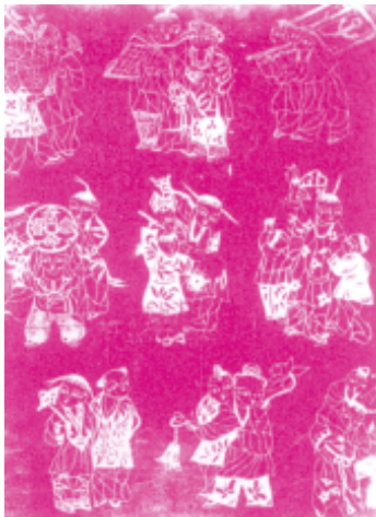
图4 百子图 熏样 北京

了我国造纸工艺质量提高，纸质薄而柔韧，剪纸线纹纤细而不断。所以，刻纸的出现，既是剪纸艺术发展的必然结果，又是中国四大发明之一的造纸工艺不断改进，人民审美生活要求不断提高的反映。剪纸只需用一把剪刀，刻纸则不然，在过去刻纸艺人的作业工具里，须有一块刻纸的垫板。垫板是一尺左右见方的木板，板上涂以黄蜡和炭灰融合而成的硬脂油，厚约五毫米余，成份是黄蜡七炭灰三的比例，以便刻纸时不伤刀之锋刃。如用久蜡面不平滑时，可加热烤化，冷却复平再用。刻纸艺人工具中无剪刀，而是一把锋利的小刀，