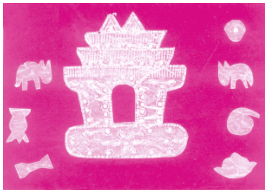
图8 银箔剪纸 敦别沙 云南瑞丽

沟,去考证周至窗花的艺术手法是不是起于汉代。但是汉代剪金箔以肖物象,与今天的剪纸艺术确可认作同一宗谱” ④ 。陕西茂陵出土的汉代金箔饰片之表现形式,不仅影响了渭河对岸的周至剪纸艺术,而且其祥瑞鸟兽之题材,也是后来全国各地剪纸艺术窗花、花样子创作的主要内容图8。又《后汉书·礼仪志》载有“立春日,立春幡”的风俗。春幡是否即剪纸艺术之最早形式,就此后发展来说,似有可能。