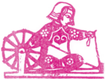
图2 上民兵 下纺纱 古元作

动：前方抗敌，后方生产，读书识字，支援前线。作品鲜明的思想内容，以窗花形式简捷地表达出来，备受西北地区人民的欢迎图1~3。当时不仅起了宣传抗日救国之作用，同时也推动了剪纸艺术的新发展。由此，引起了广大美术工作者们对民间剪纸的喜爱与珍视，不断收集它并命名为“剪纸艺术”。