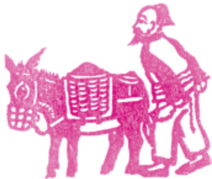
图1 送肥 古元作