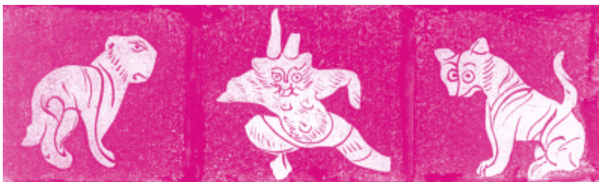
图7 兽形金箔 汉墓出土 陕西

叶为珪以叔虞，曰：以此封君。”梁·沈约据此引以为诗：“微叶虽可贱，一剪或成珪。”但削桐中成珪形，未必算作艺术。传为班固著《汉书》和干宝《搜神记》都有“李少翁”一则，言及剪纸艺术：“汉武帝时，幸李夫人，夫人卒后，帝思念不已。方士齐人李少翁，言能致其神，乃夜施帷帐，明灯烛，而令帝居他帐，遥望之。见美女居帐中，如李夫人状，还幄坐而步，又不得就视，帝益悲感。”宋·高承《事物纪原》因循此说，谓：“李少翁夜坐方帐，张灯烛于其中，以纸刻夫人像，影射于帐……”此说尝被引为皮影和剪纸艺术之起源。其实汉武帝时造纸工艺尚在试制阶段，以纸刻制成能起坐的影戏人，似应存疑。不过近年考古工作者在陕西兴平县汉武帝茂陵南侧，清理了一座汉墓，一组精巧的金箔制品是这一次发掘的重要收获。这一组异常小巧的金箔剪制的虎、象、怪兽、鸟与云气纹样饰片，箔片上用极细的墨线勾画出各种动物的细部图7。“虎、犬坐回顾，象缓缓移步，