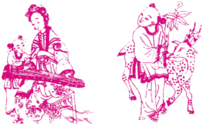
图5 松筠剪纸人物图谱 山东

刀刃上部用笔管夹住，缠以线绳。还有一把尖锥子、一只铁镊子和四五个小钉子，工具即已全备。刻纸方法：先用保留下来的旧模样，在油灯上熏出白图黑地的线纹图4；若是创制新样，则先用毛笔在一张白纸上画出图样图5，再把20或30张薄纸放在垫板上，把熏或画出的图样覆在重叠的薄纸上，用四个小钉把位置固定钉牢。一面按平纸一面依纸面画样刻，先刻镂细线，由里到外层层完成。如画面需扎小孔，则用锥子来完成。花样