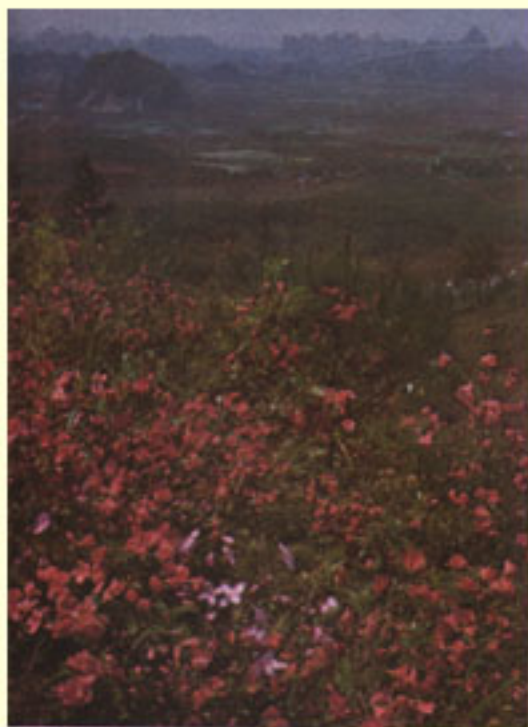
图4 桂林尧山杜鹃花