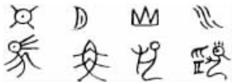
图 1-1 原图

甲骨文是可辨识的最早文字，距今有三千余年。在商代晚期，甲骨文是刻在龟甲和兽骨上的，多为占卜之用。其文字结构符号性较强，具备了古人所说的“六书”之含义。