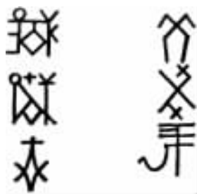
图员原原 拜占庭和哥蒂克石匠标志

公元前源到缘世纪,地中海沿岸贸易兴盛,使用标志日渐增多。罗马文明大约持续了一千年,它的最早的一部《编年经济档案》,为我们提供了商标在日常生活中占有的显著地位。从现存下来的大量陶器来看,多半是制造者及标志姓名,后来变为蜜蜂、狮头等图案。许多商人及石匠把自己的标志象征图形通过石匠艺人雕刻出来。在罗马和埃及以及巴勒斯坦的建筑物上都发现过石匠的标志:新月、车轮、葡萄叶以及类似的简单图形,如图员原原所示。