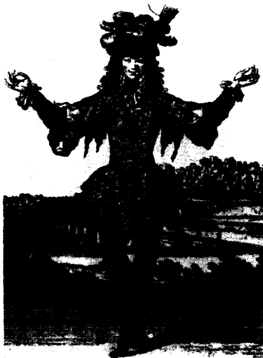
图6 通过这幅路易十四像，可以看到欧洲宫廷芭蕾舞中的舞蹈动作像宫廷中的君王处理朝政时的动作。

由于“灵魂不灭”，由于死人是“活着的”！使得埋葬仪式成为活人与“死人”的对话。虽然，死人“灵魂不死”但必然是亲人离别情感悲恸。人们最先要做的是悼念死者，寄托哀思。在中国的民族中有诸多的舞蹈是为死者的“魂”而舞。如基诺族的“舂米棒舞”、佤族的“竹竿舞”、景颇族的“金寨舞”、纳西族的“阿热热”、彝族的“跳歹”、布依族的“狮舞”、傣族的“娱尸舞”、水族的“芦笙舞”、哈尼族的“棕扇舞”、壮族人跳“三弦舞”、“牛头舞”以及畲族的击节盘旋作舞……。