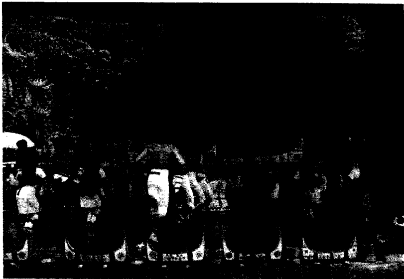
图9 台湾雅美族的祭船舞蹈，产生自雅美族的祭船仪式，学习民间舞蹈，可以熟悉各民族的文化习俗。

在教育中，体育和音乐（包括舞蹈）教育成为两个重要的支点。由于教育的目的是为了培养能征善战的英雄，教育除了学习战术技术，另外就是学习音乐舞蹈，还有培养良好的道德。英雄必须具备良好的道德水准，道德教育被视为希腊教育的核心。作战需要强壮的体格，所以竞技体育成为希腊教育的主要内容和手段，体育用于训练体格的强健和体态的优美，而音乐（包括舞蹈）用于净化人的灵魂。它们在希腊教育与生活中不可或缺，不仅对于娱乐极其重要，同时对于作战发挥着十分重要的作用——在战斗中，勇士们唱着歌与敌人拼斗。在舞蹈教育中，要求培养英雄们的体格不仅要健壮，而且要优美，不仅要灵活，而且要和谐。正是由于这样的教育，古希腊的英雄，每一个人都是活生生的男人或女人，每一个人都是拥有完整人格的个体，每一个人都是一个充满生气的世界，每一个人都是朝气蓬勃、充满力量、不畏强暴的人生楷模。