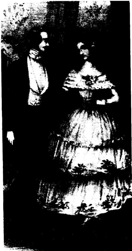
图7 欧洲古代宫廷用舞蹈培养贵族们典雅的气质

舞蹈教育的兴盛往往是在人类社会思想最活跃、人类的智能与体能高度发达的时期。据史书记载，中国的乐舞教育将“六艺”（礼、乐、射、御、书、数）作为学校教育的主要内容形成于夏、商、周时期（公元前21世纪—公元前771年），在西周时达到高峰。马端临的《文献通考·学校》中日夏以射造士，商以乐造士，周以礼造士，便是指出，