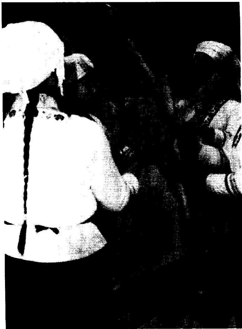
图 3 民间打扁担舞，表现的内容有插秧、车水、收割、打鼓等模拟劳动的动作。

如《竹篮舞》、《捕鱼舞》、《饭篮舞》等 随着象脚鼓与芦笙的伴奏 男女青年结伴而舞，边舞边唱，表演各种生活、生产场景，风趣幽默。非洲索马里的《索古尔》舞蹈是表现春耕、庄稼收获以及储存农产品的生活。在今日遗存的世界各民族的民间舞蹈中的《捕鱼舞》、《摘葡萄舞》、《采茶舞》、《织网舞》、《打柴舞》、《舂米舞》、《收麻舞》、《采棉舞》、《打猎舞》、《牧马舞》、《收割舞》、《纺织舞》、《插秧舞》、《挤奶舞》……都告诉我们劳动与物质生产是舞蹈表现的重要内容，也让我们联想到远古人类将其用于教育后代的那些生动的场景。