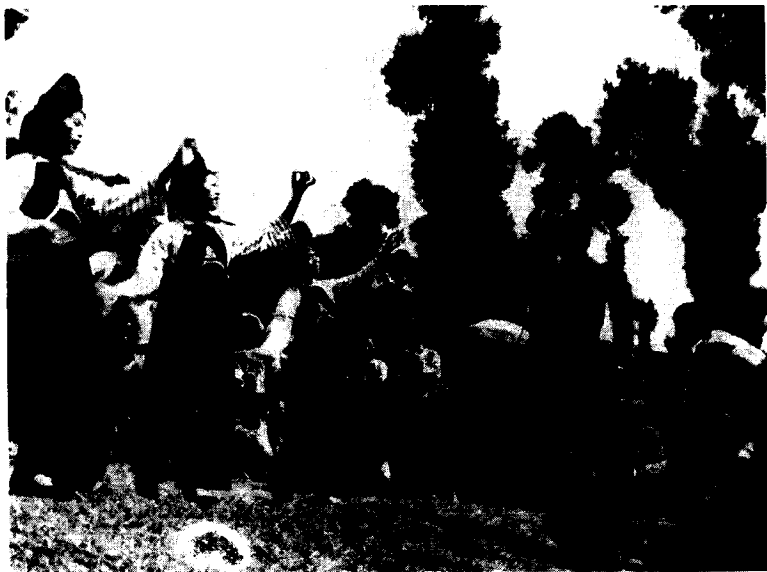
图 5 布依族《纺织舞》在传统舞蹈中具有传授劳动技能的功能。

吹鼓手；法律的执行人，礼制形成的促进者以及文字的发明者。 ⑩ 原始社会疾病流行，生老病死对人类威胁至大，舞蹈与生俱来有着强身健体之功效，在治愈疾病方面，具有一定的疗效，亦使巫师跳神治疗得以受到信任的一个重要原因。流行于中国内蒙古哲里木盟地区的民间歌舞《安代》，除了源于萨满巫师驱鬼求雨之外，在治病方面也十分著名，尤其是治疗“魔鬼附体”带来的疾病和女子由于对婚姻爱情不满带来的精神疾病，以及妇女婚后久不孕症十分有疗效。《安代》为蒙语“奥恩代”的变音，其意为“抬起头来”。巫师在歌舞的开头让病人“抬起头来”，以便察言观色，然后借助宗教的神秘力量，以及人们信仰的力量，以心理的暗示，达到精神的舒解。使受损害的女性的精神、心灵和肉体的折磨与压抑得到缓解，同时在歌舞的狂欢与迷狂的宣泄中获得心灵的慰藉与精神解脱，使失常的精神病症得到缓解，或使精神紧张带来的不孕症与其他病症消失。这种歌舞多伴有劝慰病人的词曲，形成许多优秀的民歌，以其幽默、活跃的气氛，使病人开怀，使人们身心畅快。