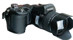
▲ 索尼 F828 800万像素(家用)