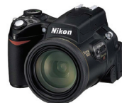
▲ 尼康 CP8800 800万像素(家用)