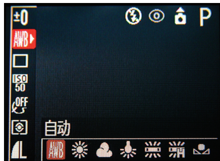
▲ 这是一台家用数码相机的白平衡设置，可以适应不同的色温