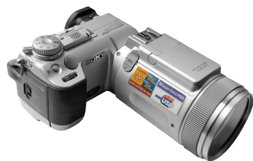
▲ 索尼 F717 500万像素(家用)

第3种 摄影发烧友或职业摄影师使用：建议购买600万像素以上的数码相机。最最重要的是选择可以更换镜头的数码相机，根据自己的需要，配备各种镜头。