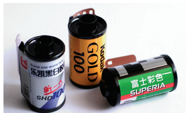
▲ 传统相机使用的胶片

传统相机是由镜头汇聚光线，投射到银盐胶片上感光成像，以化学的方式将影像记录在胶片上。数码相机也是由镜头汇聚光线，这一点没有变化，不同的是，感光成像的已经不是胶片，而是影像传感器（CCD 或 CMOS）把感应到的光信号转换成电信号，然后还要将电信号转换成数字信号。最后把数字信号按特定的格式存入到存储卡上。