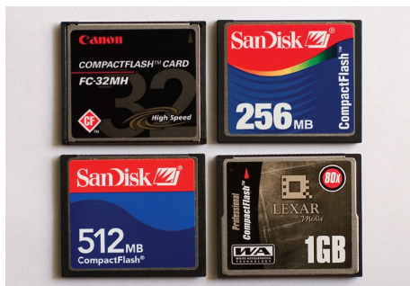
▲ 存储卡的大小不同，可以拍摄的照片数量也不一样