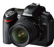
▲ 尼康 D70S 610万像素(专业)