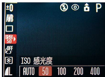
▲ 这是一台家用数码相机的感光度设置从 50 到 400，调整起来很方便

数码相机也有一些不尽人意的地方。比如数码相机整体来说都要比传统相机贵，前期投入要大一些。家用数码相机快门延迟，大尺寸照片存储速度较慢，需要等待。另外，大部分数码相机的 CCD 面积还不能实现全画幅，广角端镜头不能得到充分利用。还有就是大部分的数码相机，整体像素还是低，不能达到传统相机、特别是 120 以上胶片机的放大尺寸。当然这些都是更高的要求，随着数码相机的不断发展，这些问题也会逐渐解决。现在的数码相机对于一些尺寸要求不大的照片来说，其冲洗和印刷质量已经是不错了，对于摄影发烧友来说，也已经是足够用了。