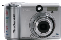
▲ 佳能 A95 500万像素(家用)