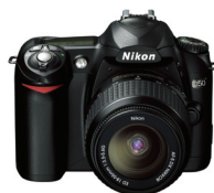
▲ 尼康 D50 610万像素(专业)