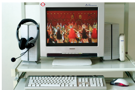
▲ “数码暗房”的意思就是在电脑上对数码相片进行“后期处理”

传统摄影无论是用底片还是相片的形式保存，时间长了都会褪色、变质。而数码相片的文件保存在硬盘里或是刻录在CD-R光盘里，其影像色彩是永远不会变的。