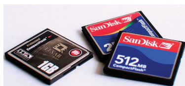
▲ 数码相机使用的存储卡

用传统相机拍照，只能等一个胶卷拍完送到冲洗店冲洗出来后，才能看到照片的效果。如果照片质量不好，或是完全拍砸了，也因时过境迁而无法弥补了。恐怕很多人都有这种惨痛的经历吧。而数码相机设有 LCD（液晶显示屏），按动快门后，立即就可以在 LCD 上看到所拍摄的影像。如果效果不理想，你可以马上删除，或对相机设定做出相应的调整。数码相机还可以提供拍摄数据，你可以参照数据重新拍摄，直到你得到满意的照片。数码相机还设有直方图，可以直观地显示你所拍摄的照片影调是否完整。