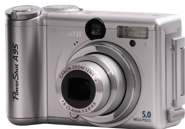
▲ 家用数码相机镜头和机身是一体的

家用数码相机的镜头和机身是连成一体的，不能更换。你买的相机配备的是什么镜头，你就只好使用什么镜头。而专业数码相机的镜头是可以更换的，使用者可以根据自己的拍摄题材使用各种镜头。有些家用数码相机也配备了质量很好的镜头，有很棒的成像质量，但毕