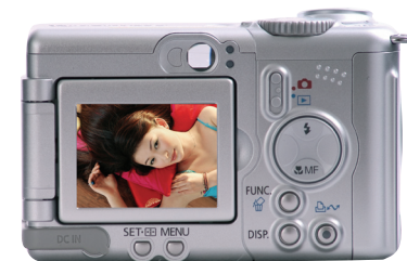
▲ 数码相机配备的 LCD（液晶显示屏）

即拍即现的功能是数码相机革命性的成果，它让你拍摄时心里踏实，当我们记录人生重要时刻的时候，这项功能可以帮助我们避免遗憾。