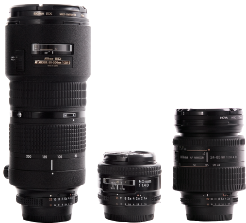
▲ 专业数码相机的镜头是可更换的

焦距是镜头光线入射点到焦平面（CCD）的距离。焦距的长度以 mm（毫米）来表示。通常镜头的焦距越大镜头也就越长。镜头焦距的不同有什么意义呢？定焦镜头与变焦镜头又有什么实际作用呢？（为了叙述方便，下面以 135 传统胶片相机为例加以说明）