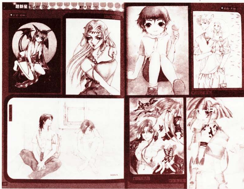
> 明显带有日本漫画痕迹的中国漫画

漫画发行量的巨大也意味着读者群惊人的广泛性。漫画最初不啻孩子们的读物，可在20世纪60年代以后，逐渐成为了青少年们的阅读媒体，并且，随着这些读者的长大成人，由他们形成了当今一个庞大的“漫画世代”。不仅如此，在20世纪80年代后期出现了面向依靠退休金生活者的漫画杂志，专门以退休后的第二人生为表现的主题。而