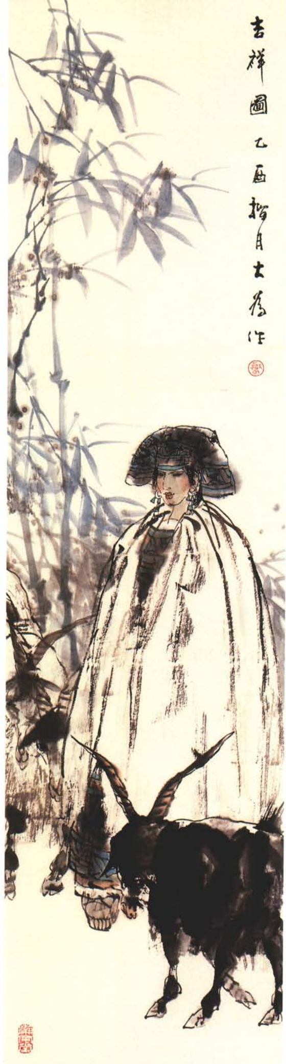
吉祥图 (中国画) 180 × 45cm