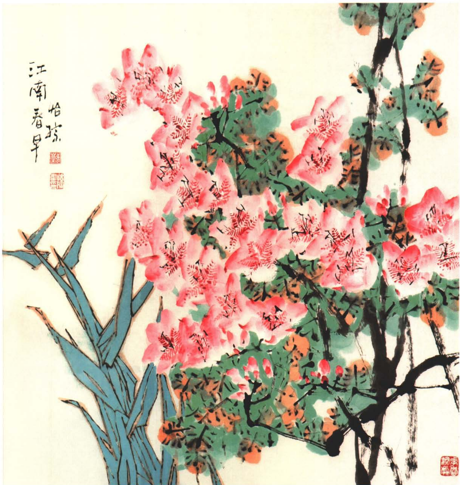
江南春早（中国画）68×50cm 郭怡琮