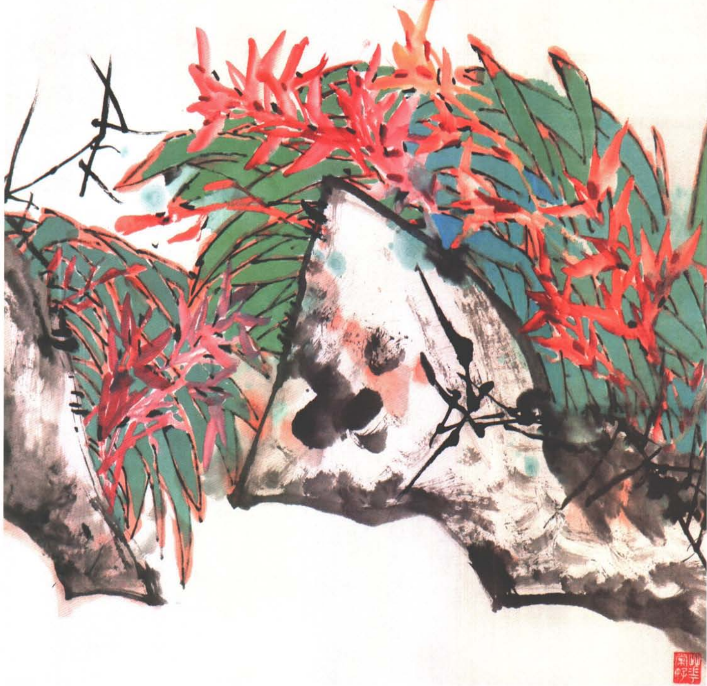
滇南春早（中国画）68×50cm 郭怡踪