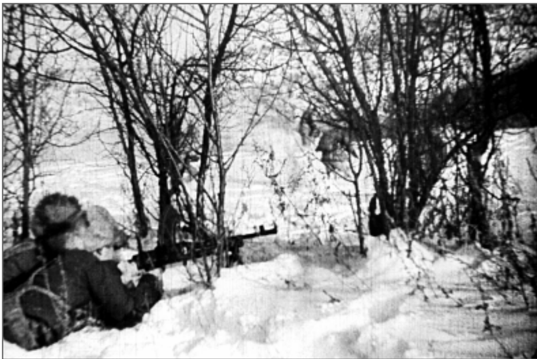
1. 1947年初春，东北战场依然北风呼啸，飞雪弥漫，一片冰天雪地。伟大的人民解放战争正在紧张地进行。