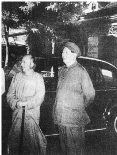
毛泽东和柳亚子在一起

印楼主”曹立庵精选了两块寿山石料，刻了一方白文“毛泽东印”，一方朱文“润之”印。两印布局自然和谐，端庄古朴，线条浑厚灵动，朴拙大气。印刻好后，柳亚子先将两方新印钤在毛泽东抄送他的《沁园春·雪》上，然后奉赠毛泽东。1946年1月28日，毛泽东寄函柳亚子，表示收到了印章：“很久以前接读大示，一病数月，未能奉复，甚以为歉……印章二方，先生的和词及孙女士的和词，均拜受了。”