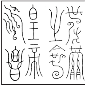
受天之命 皇帝寿昌 (缪篆)