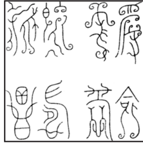
受命于天 既寿永昌 (鸟虫篆)