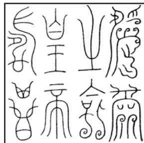
受天之命 皇帝寿昌 (缪篆)