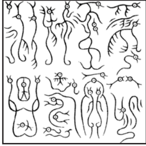
受命于天 既寿永昌 (鸟虫篆)