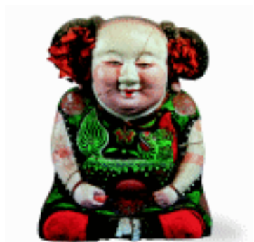
大阿福 泥 清 无锡泥人研究所藏

4. 实用玩具 具有实用功能的玩具，这类玩具除用来娱乐嬉戏之外还可作为卧具使用或当食品食用。如虎枕、