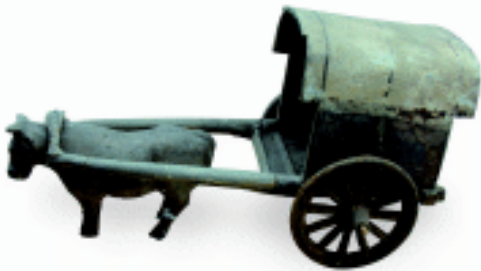
牛车 陶 东汉 邯郸博物馆藏