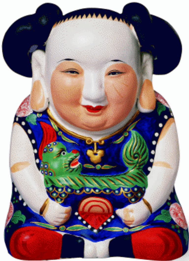
大阿福 泥 江苏无锡 喻湘涟、王南仙作