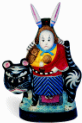
秋季玩具 兔儿爷 北京 双起翔

腊月人们要买糖瓜祭灶王爷，让他“上天言好事，下界保平安”；要扫房子，贴春联，贴窗花；要去赶集市，置年货。热闹的集市上出售玩具摊位一家连着一家，泥人、泥虎，响车、响篮，瓷人、瓷哨，木枪、木刀，各类玩具应有尽有。人们会给孩子们买上几件过年玩的玩具，也会买上带有吉祥寓意的玩具来装饰家具，增添节日气氛。在陕西凤翔春节前，百姓人家会买上一个泥挂虎悬挂在家中，镇宅除邪、消灾免祸。泥挂虎，造型为装饰性的虎头，巨头环眼，阔嘴高鼻，双耳直竖，又装饰石榴、牡丹、莲花等有吉祥如意花草，色彩艳丽，对比强烈，威武神气。还要摆上大坐虎，它高大敦实，气势威猛，色彩浓烈，富有装饰性，给人喜庆、热烈的感受。被当地的人们视为驱灾