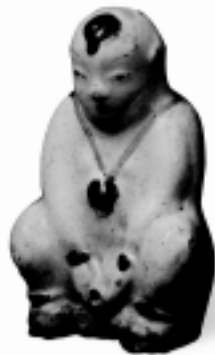
磨喝乐 瓷 宋 王树村藏

到了宋代，民间玩具进入繁荣期。宋代商业经济高度发达，市民阶层的文化生活迅速发展，玩具进入了市民阶层的家庭生活之中。玩具品种丰富，有泥塑玩具、陶瓷玩具、竹木玩具等。尤其是泥塑玩具，春天捏“黄胖”，秋季做“磨喝乐”。“黄胖”是南宋清明节到郊外游春时买给孩子玩的小泥人；“磨喝乐”又称“摩睺罗”，北宋时七夕节售卖的手执荷叶的泥塑胖娃娃，是大人给小孩子买回去“乞巧”的，具有吉祥宜子的寓意，是当时上至宫廷贵族下至平民百姓竞相购买的吉祥物。孟元老的《东京梦华录》中说：“七月七夕，潘楼街东门外瓦子，州西梁门外瓦子，北门外，南朱雀门外街及马行街内，皆卖磨喝乐，乃小塑土偶耳，悉以雕木彩装栏座，或用红纱碧笼，或饰以金珠牙翠，有一对直数千者，禁中及贵家与士庶为时物追陪。”1976年在镇江五条街宋代遗址出土了一组五人的泥孩儿，最高者16厘米，泥人身上有“吴郡包成祖”、“平江包成祖”、“平江孙荣”的戳记。吴郡、平江均为苏州旧名，可知作品出自宋代苏州泥塑高手。泥塑五孩嬉戏的情节，或爬、或仰卧、或站、或坐，姿态各异，神情生动，展现了宋代民间泥塑的水平，甚为珍贵。从宋代起，泥玩具的生产与销售遂成行业，遍及各地。宋代的陶瓷烧制技术达到了高峰，