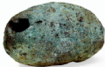
陶球 浙江省河姆渡遗址出土