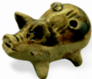
音响玩具 陶哨 云南建水