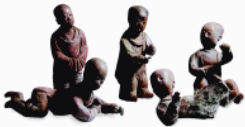
五孩嬉戏 泥 宋 镇江博物馆藏