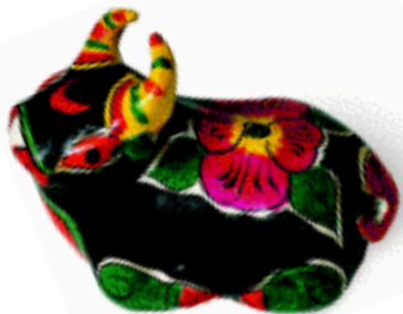
春季玩具 泥 陕西凤翔

浚县的庙会刚过,河南淮阳的“人祖庙会”就开始了。淮阳古称“宛丘”、“陈州”,传说是人祖伏羲与女娲结合造人的地方。每年农历二月初二到三月初三,都要举行盛大的“人祖庙会”。庙会中,人们除了祭人祖伏羲外,还有掏子孙窑(女阴)、拴娃娃、购买“泥泥狗”等带有生殖崇拜的民俗活动。“泥泥狗”是在庙会上出售的一种黑底彩绘泥玩具,是善男信女们争相购买回去避凶、纳吉、求子的吉祥物。这些彩塑都捏塑得古拙、奇妙,而带有神秘的趣味,其中有一种人面似猴的泥泥狗,人称“人祖”“人祖猴”,身上绘有女性生殖器的纹饰。还有许多叫不出名的奇禽怪兽,使人们好像看到了原始社会林立的图腾,因而“泥泥狗”被称为“活化石,真图腾”。