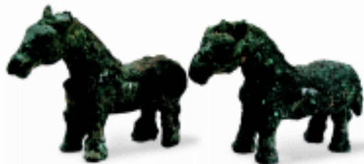
小马 青铜 西周 河南省博物馆藏