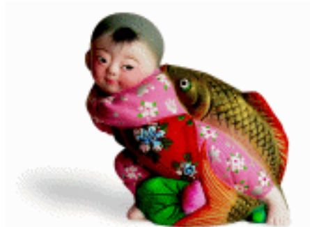
观赏玩具 天津泥人张 杨志忠