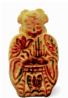
实用玩具 食品玩具 河北蔚县