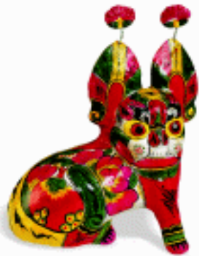
冬季玩具 大坐虎 泥 陕西凤翔