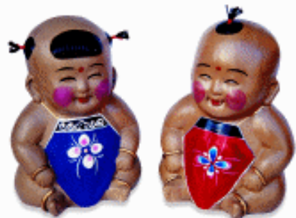
冬季玩具 北京 双起翔