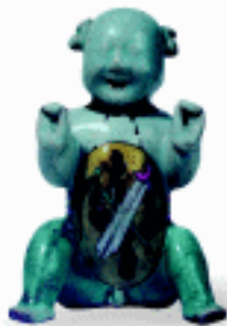
娃娃 彩瓷 清 景德镇 王树村藏

出现了五大官瓷——官瓷、汝瓷、钧瓷、哥瓷和定瓷，民窑也散见于各处，烧制的瓷玩具也悄悄进入了市场，也呈现一片繁华气象。