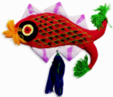
夏季玩具 香包 陕西