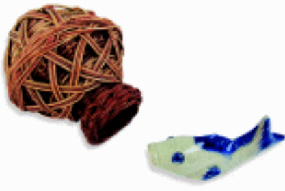
编扎、陶瓷玩具 湖北