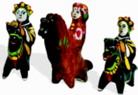
春季玩具 河南浚县泥咕咕