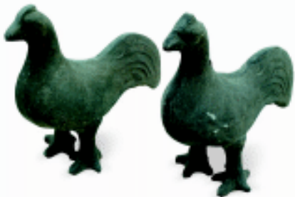
鸡 陶 东汉 邯郸博物馆藏

精心加工，内外光滑，骨上打孔，两孔、三孔或七孔不等。河南舞阳贾湖出土的骨笛，距今已有8000余年，而且已具备7个音阶。它既可用于狩猎诱捕，也是一种原始乐器，又可给孩子玩耍。