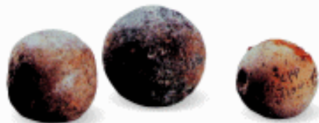
陶球与石球 西安半坡和临潼姜寨遗址出土

骨笛（哨），是原始先民在狩猎时，模仿禽鸟鸣声，诱捕猎物的用具。是渔猎生活中的又一创造，它是用禽兽肢骨做成。在黄河上游的卡窑、江苏吴江梅堰、河南舞阳、浙江河姆渡等新石器时代文化遗址均有出土。浙江河姆渡遗址出土的骨笛多达160余支。骨笛是截取大型禽鸟的肢骨，将两端磨平，口径在1厘米左右，长约10厘米。骨管经过