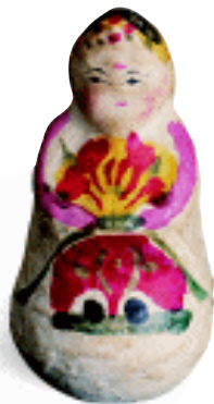
春季玩具 不倒翁 河北玉田