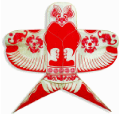
节令玩具 北京风筝 郑军