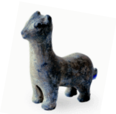
狗 陶 汉 孔令熙藏