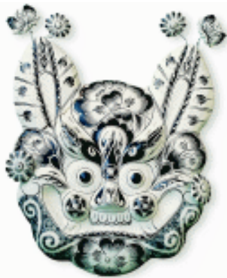
冬季玩具 泥挂虎 陕西