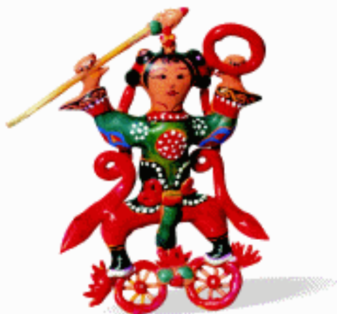
冬季玩具 哪吒 面塑 山东冠县