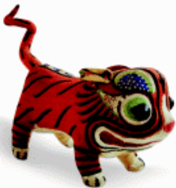
夏季玩具 布老虎 北京