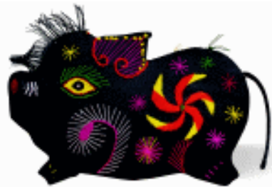
布玩具 香包 陕西