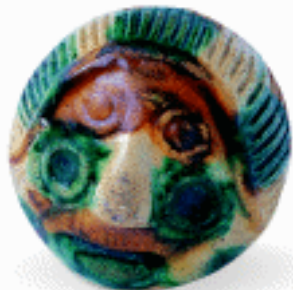
人面哨 唐三彩陶 唐 李寸松藏