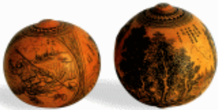
戏剧故事 雕刻葫芦 甘肃

草药，借布老虎的“虎威”来驱五毒……它们逐渐演变成节日玩具。香包的花色样式很多，如猪狗牛羊、飞禽走兽、瓜果梨桃、鱼虫虾蟹等。按旧俗，端午节佩戴的香包，在节日之后要焚化或抛弃，不能捡拾，否则不吉利。