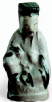
吕洞宾瓷 明 李寸松藏