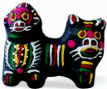
春季玩具 河南淮阴泥泥狗