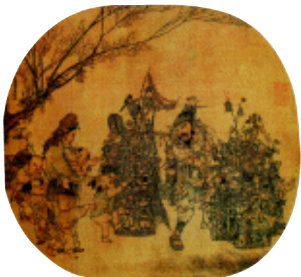
《市担婴戏图》 宋 李嵩