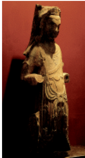
菩萨 彩绘石雕 六朝 山东青州