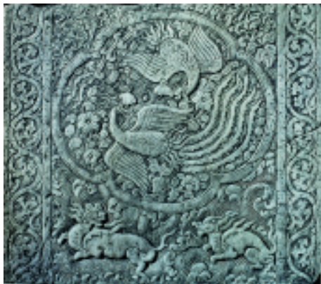
双凤麒麟 元 北京