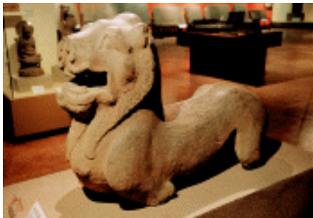
石狮子 汉 山东