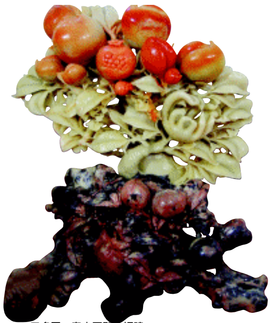
三多图 寿山石雕 福建