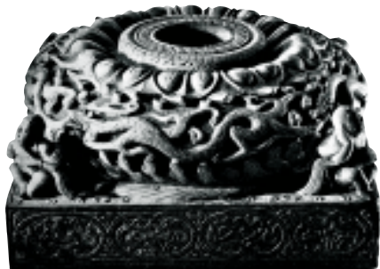
石础 北魏 山西大同