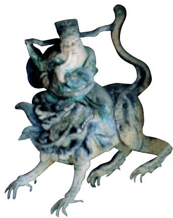
人物纹梁架构件 潮州己略黄公祠