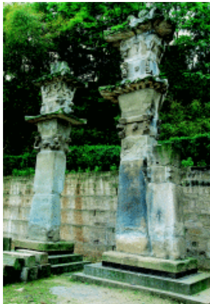
汉阙 重庆忠县白公祠