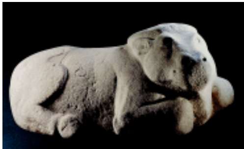
卧牛 西汉 霍去病墓

建筑石雕、陈设石雕等；以石料品种或产地划分，有青田石雕、寿山石雕、曲阳石雕、菊花石雕等。