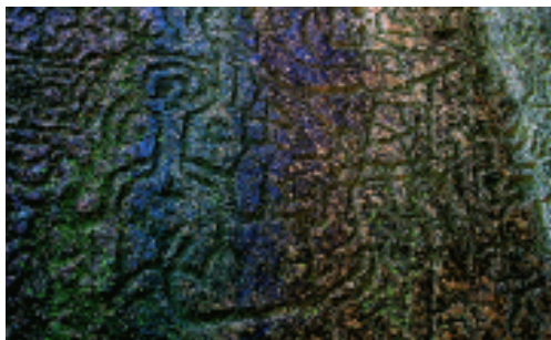
摩岩石刻 广东珠海高栏岛