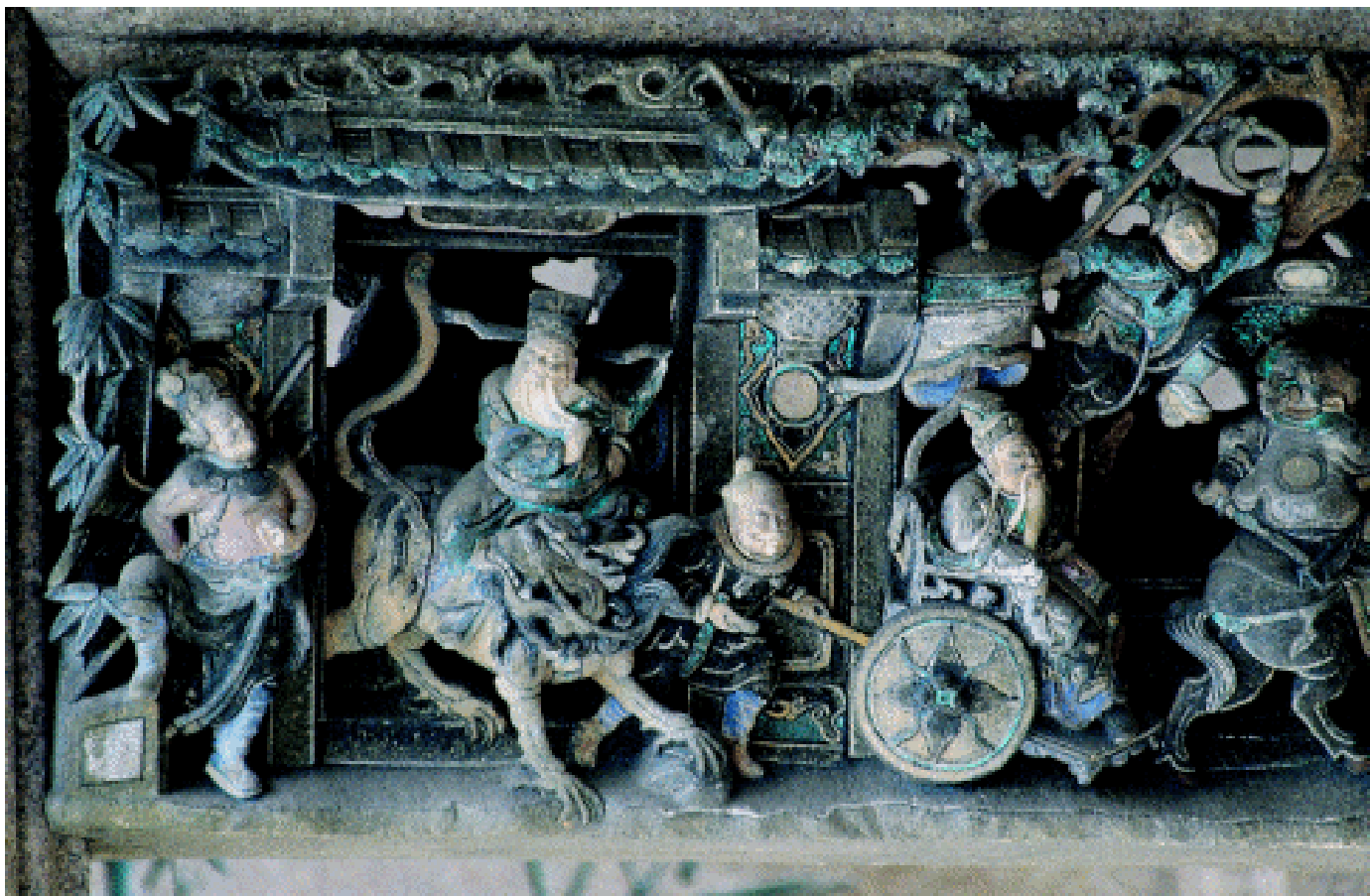
人物纹梁架构件 潮州己略黄公祠