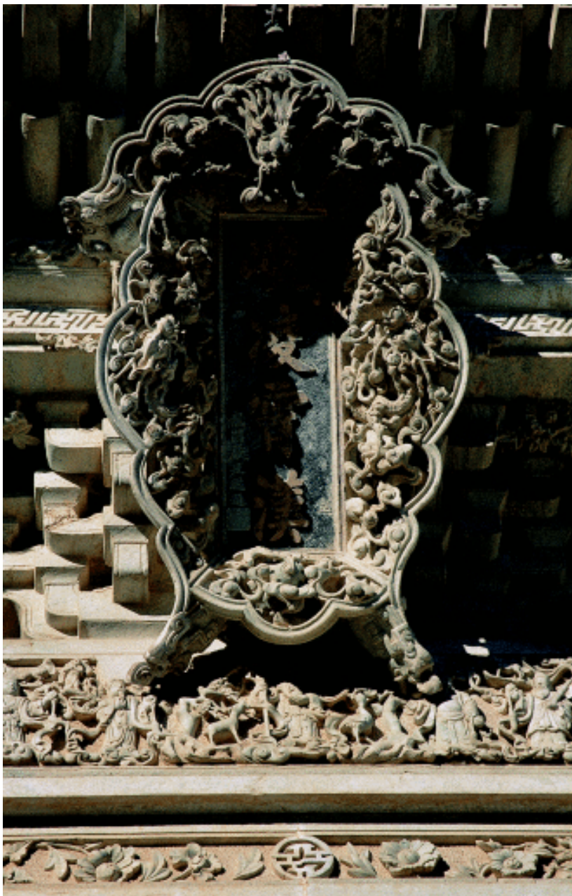
梁架上的额扁 潮州己略黄公祠