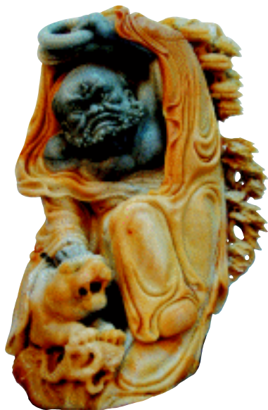
罗汉 寿山石雕 福建

息；强烈的对比色彩，大胆夸张的变形与饱满、匀称的造型，完美的构成形式与内容有机地结合，传承着中国农耕社会的传统审美观念、理想情趣和精神需求。