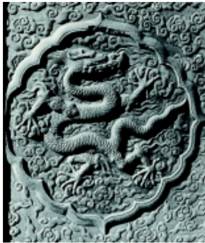
云龙纹石雕 明 北京