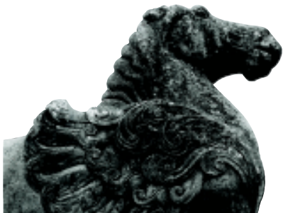
天马 唐 咸阳乾陵