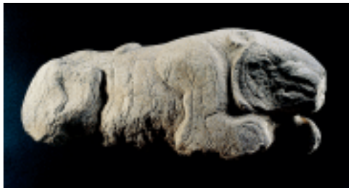
卧虎 西汉 霍去病墓