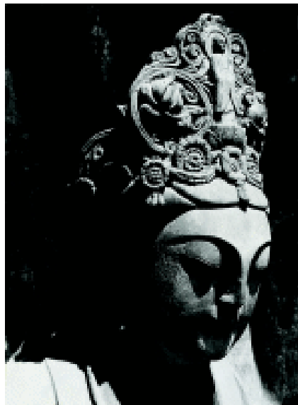
菩萨 宋 重庆大足