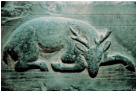
鹿纹石雕 汉 山东