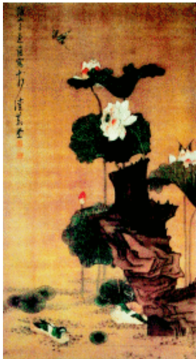
荷花鸳鸯图轴 南宋 李嵩