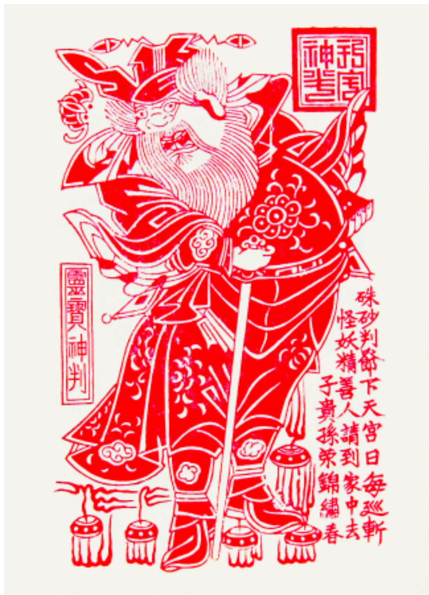
灵宝神判 陕西凤翔