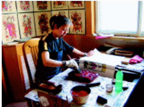
刷色工艺 陕西凤翔凤怡年画社