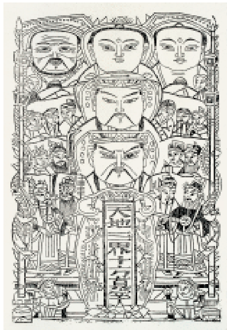
天地全神 纸马 河北保定