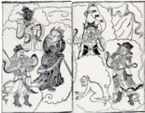
目连救母劝善戏文插图 明

当时的门神有上古传说中的神荼、郁垒以及勇士。青龙、白虎、朱雀、玄武“四神”是汉代通行的祥瑞图符。汉代门画多绘画于木门之上，岁月侵蚀，今已荡然无存，从汉墓室画、画像石和画像砖上或可见其风采。至于灶君形象，《后汉书·阴识传》有载：“腊日晨炊而灶神见，子方再拜受庆”，或可作为灶神形象的印证。