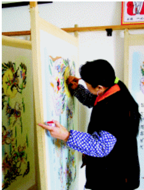
染色上色工艺 天津杨柳青年画馆