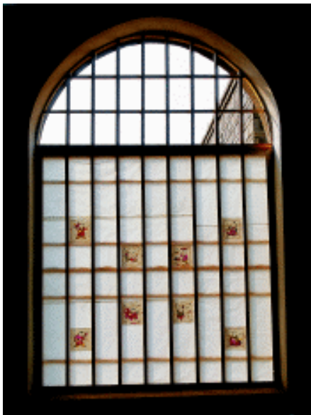
北方民居的窗画 窗花 河北武强