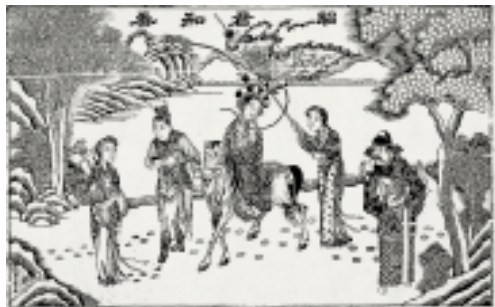
昭君和番 清朝 李寸松藏

起,上海开始出现印有阳历日期的月份牌,随发行的彩票一起奉送,称之为《沪景开彩图》。其上印有沪景名胜、花卉、人物以及彩票的宣传文字;风格上既有民间传统年画的形式,又有西方绘画的表现手法,色彩艳丽明朗、景物描写细腻。另有一种条屏形式的年画,作为宣传产品的广告招贴,如香烟广告年画。