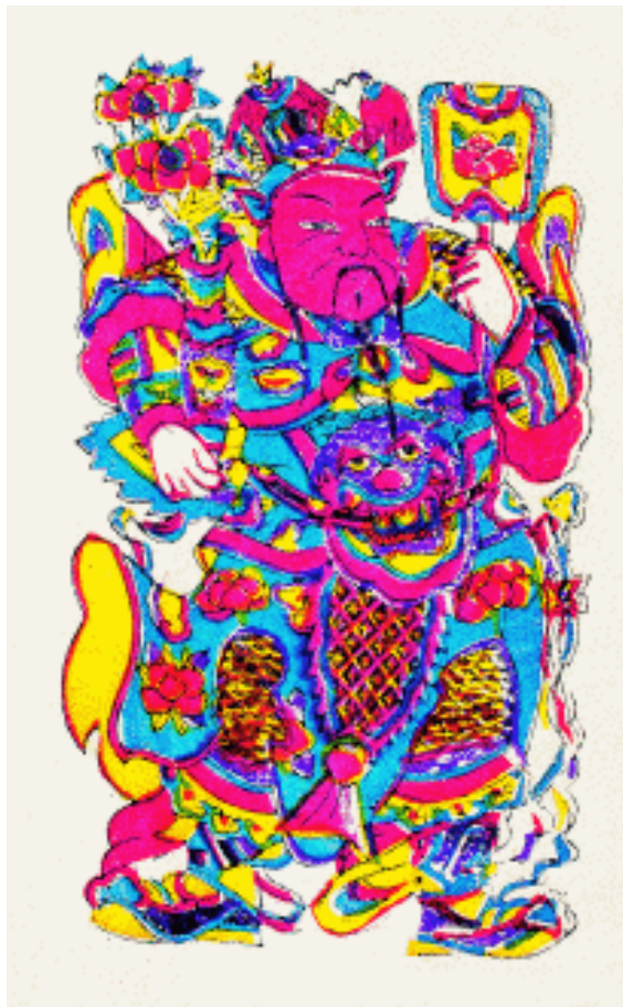
神荼 郁垒 山东潍坊