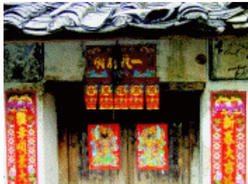
民居大门上的门神、门笺与对联 珠海淇澳

房门画 即贴在居室门上的年画,题材较广泛,可贴“门官”,也可贴寓意吉祥的娃娃或美人,前者称之为门