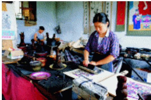
刷印工艺 山东潍坊青云山年画馆