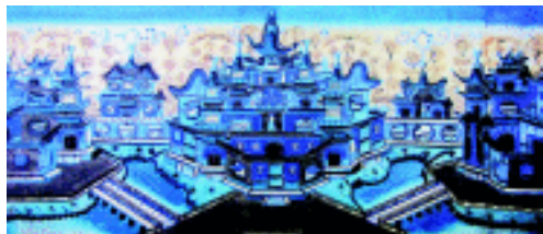
西域楼阁图 清 北京