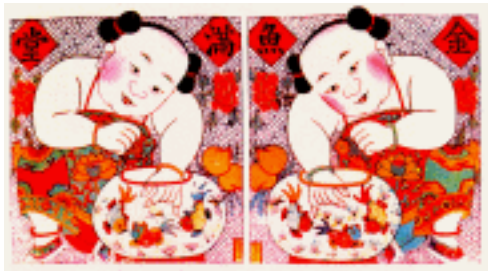
金玉满堂 毛方子 山东潍坊