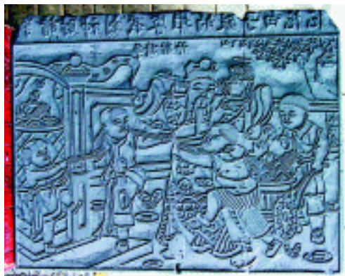
年画印版 山东潍坊 青云山年画馆

地方特色，多以红纸为底，套印黑线和黄、绿、白、蓝等色，风格单纯、强烈；题材以门画和“招财进宝”之类的吉利画为主。漳州年画老字号以“颜瑞华”最著名，门画多选用红纸，再套印粉绿、粉黄、粉蓝等色，题材以风俗时事和戏文故事为主；寺庙门画有时选用黑纸作底，套印粉蓝、朱红等色，题材多为四幅一套，如福、禄、寿、喜四神，象、狮、虎、豹四兽，或牡丹、荷、菊、梅四季花卉；一般年画以白纸为底，套印墨线及红、橙、绿等色。漳州地区的纸马品种丰富，包括《寿子财》、《三星图》、《招财进宝》、《妈祖》和《八卦符》等；常在白纸上套印红线或加印黄、金等色，也有在黄纸上印红线或黑线的。