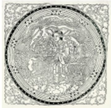
天仙送子 月光 陕西凤翔