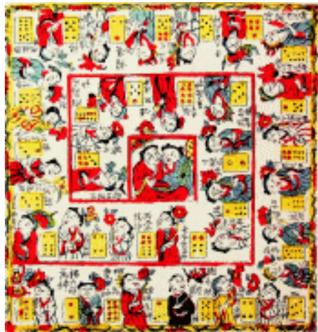
十二花神 彩选格 苏州桃花坞