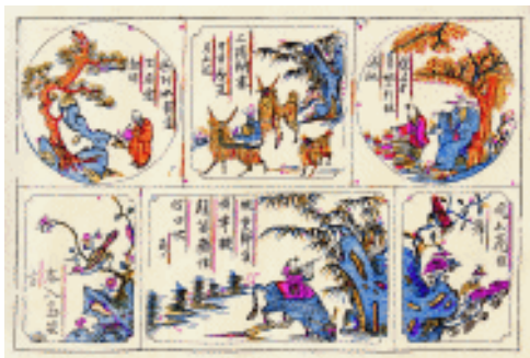
人物山水 格景 河北武强

神像称之为常供神像,多为木版彩印;在祭供之后需焚化的神像称之为祭化神像,一般为单色印刷,多数可归于纸马范畴。