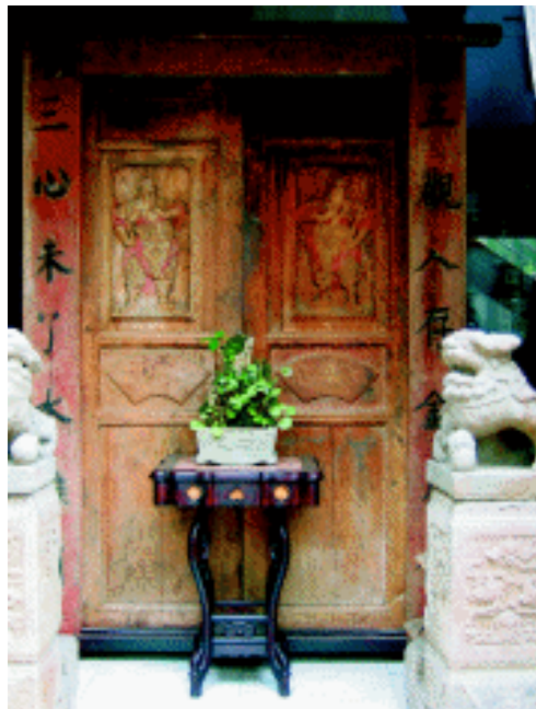
刻在门上的武门神 四川