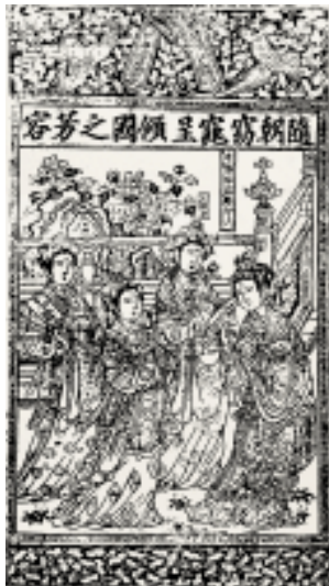
隋朝窈窕呈倾国之芳容 金 山西临汾

民国时期的年画，既描绘传统的民俗生活，又反映社会的新风气新时尚，因而称之为“新年画”。月份牌年画是这一时期年画的新宠。清代末年，随着石版印刷的兴