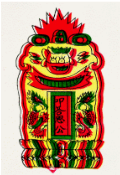
叩答恩公 神位牌 福建