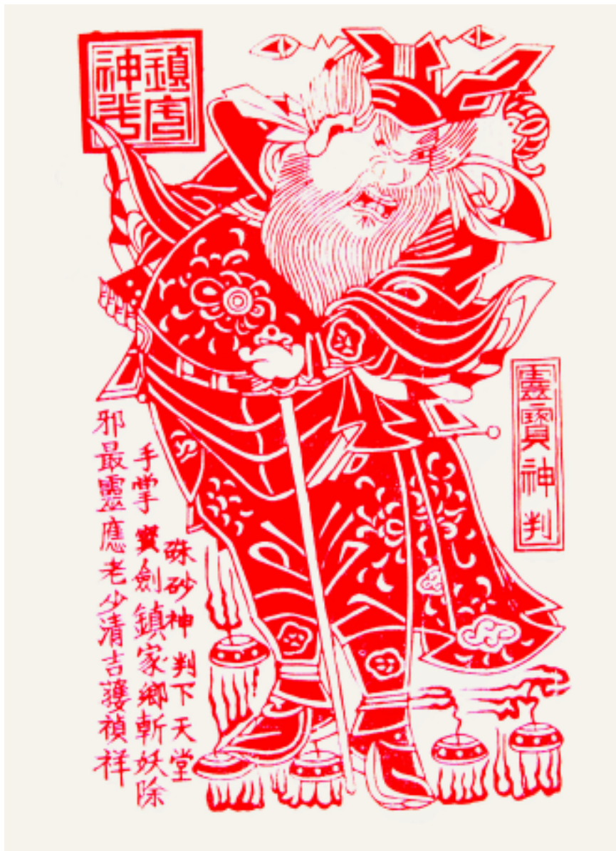
灵宝神判 陕西凤翔