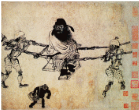
中山出游图 宋末元初 龚开