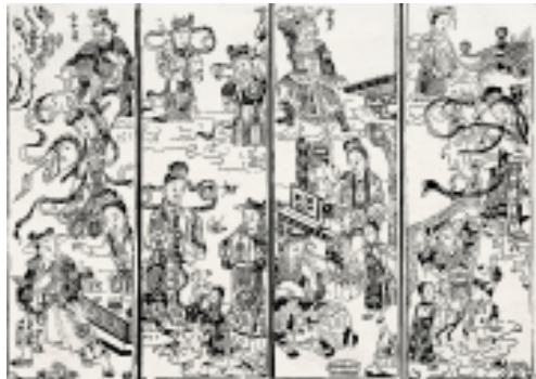
牛郎织女 通景 河北武强