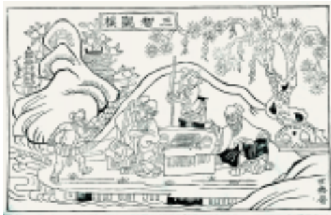
三智观棋 三裁 陕西凤翔