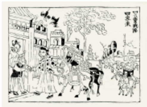
买卖兴隆回家来 贡笺 陕西凤翔

民间诸神 即中国民间的诸多俗神。历史上中国民间以多神崇拜为其特征,包括日、月、山、川中的自然神,衣、食、住、行中的杂神,以及虽死犹存的“人鬼”。这些神也是释、道、儒等宗教崇拜的神祇。神像是年画的主要品类之一,按功能可将其划分为两类:用于常年供奉的