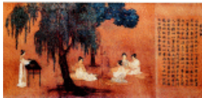
女孝经图 宋 无款