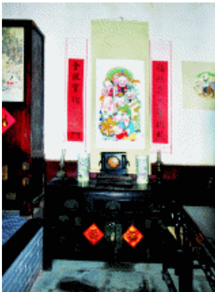
民居中堂年画 天津石家大院

童,后者称之为美人条。由于房屋门既有双扇也有单扇,所以房门画也有双幅、单幅之分。