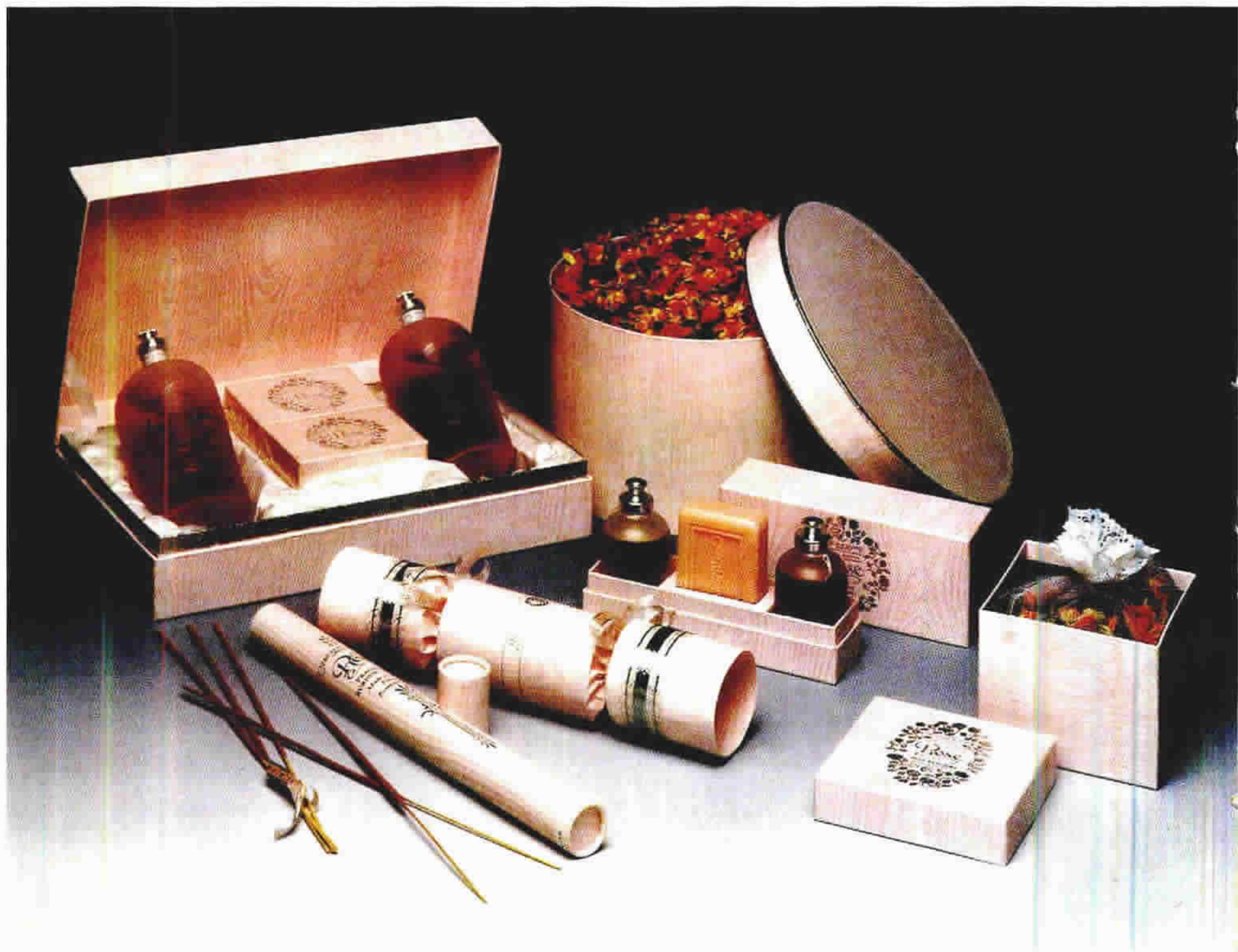
图 1-31 清新、浪漫的女性用品礼盒