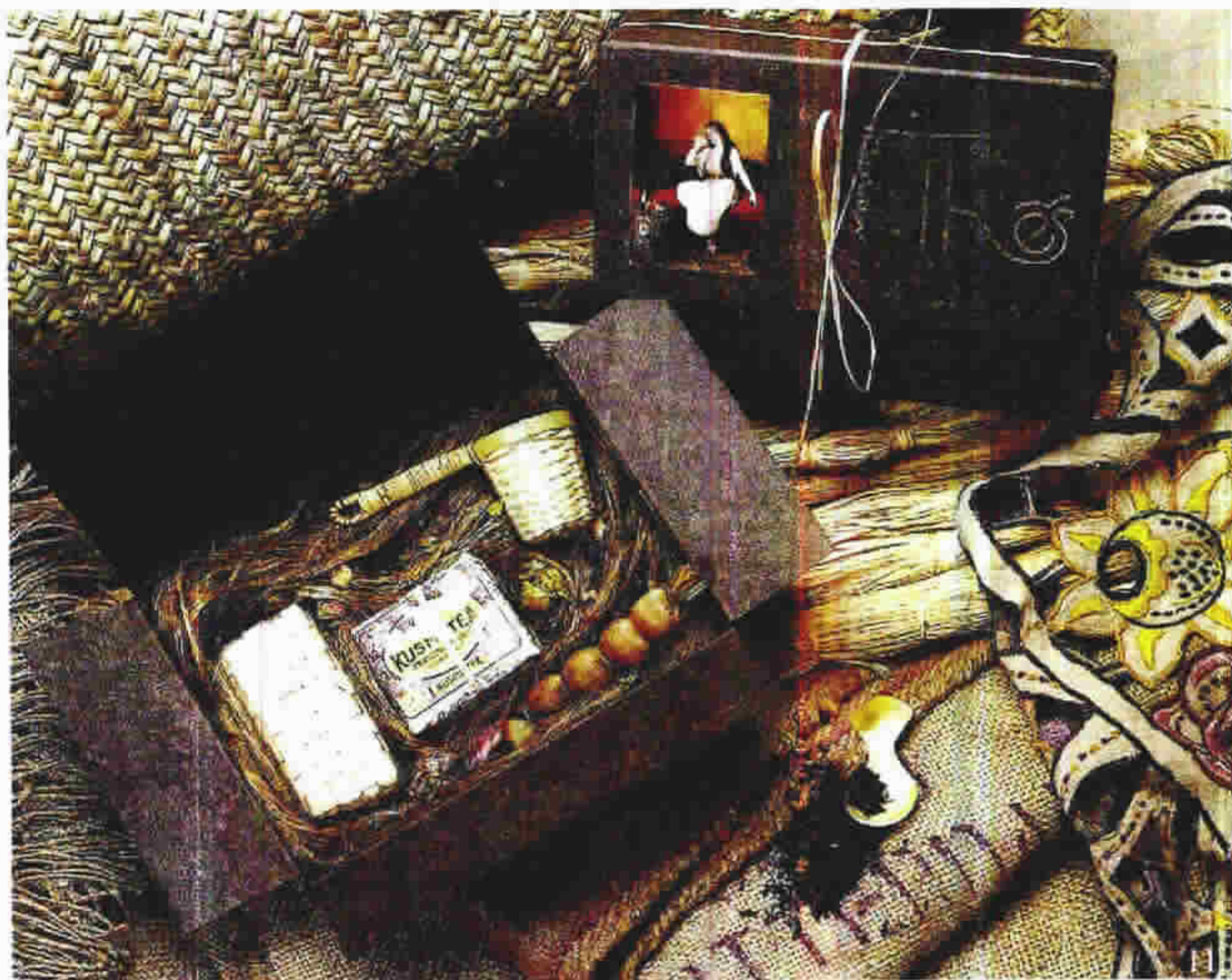
(图1-6) 法国茶环保礼品盒包装

(图1-5) 采用再生纸和自然材料做成的文具用品包装朴实得仿佛回到了十八世纪的农庄。