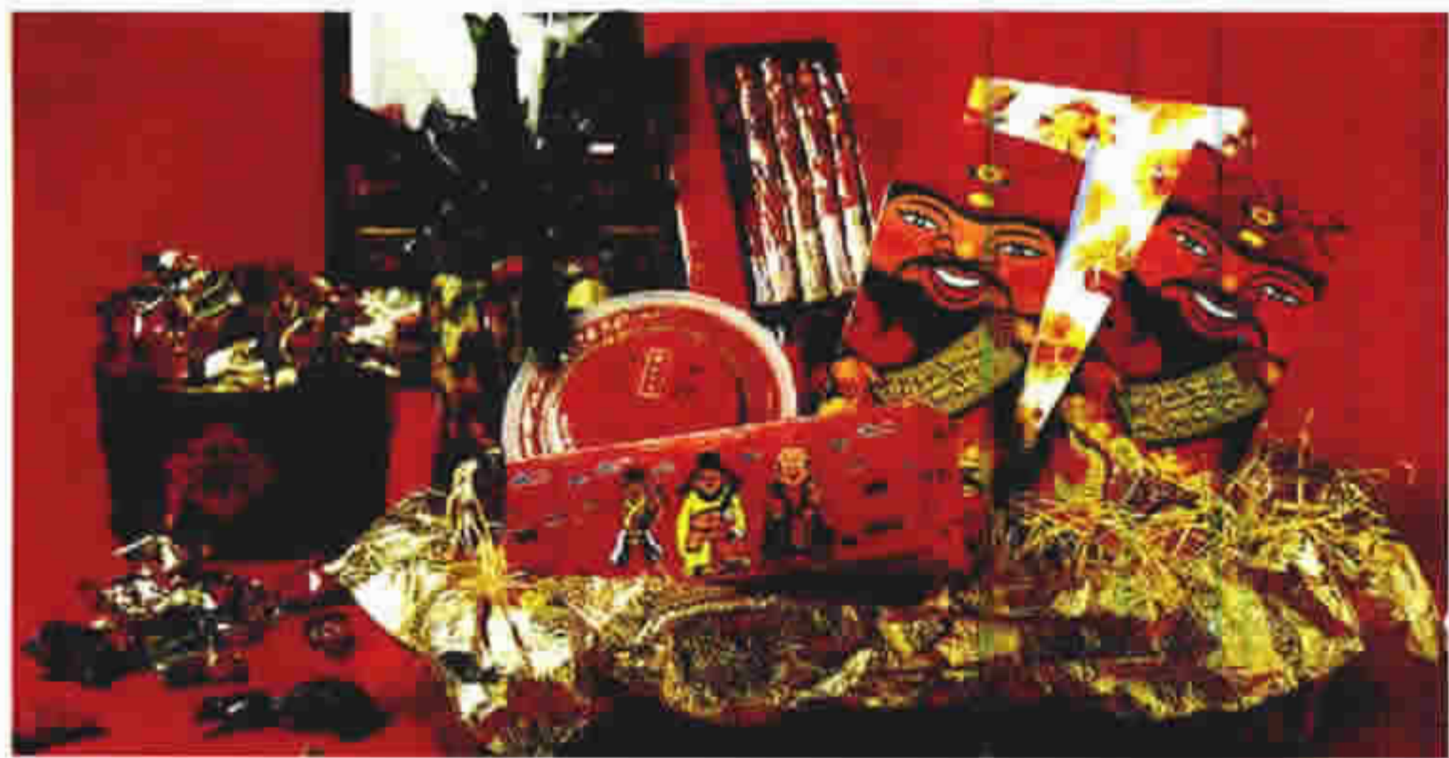
(图 2-1) 中国民俗味极浓的礼品包装 (图 2-1) 充满异国风情的喜饼礼盒

异彩纷呈的各国各民族文化有着彼此千差万别的体征和内涵。在漫漫历史长河中，这独特的、带有强烈的本国本民族色彩的体征和内涵滋生出了各具特色的礼仪、礼俗，且拥有千百种不同的外在表达方式——舞蹈、音乐、戏曲、壁画、服饰、礼品等等。优秀的礼品包装——把图案、符号、文字、美感、信息、民俗、情谊集于