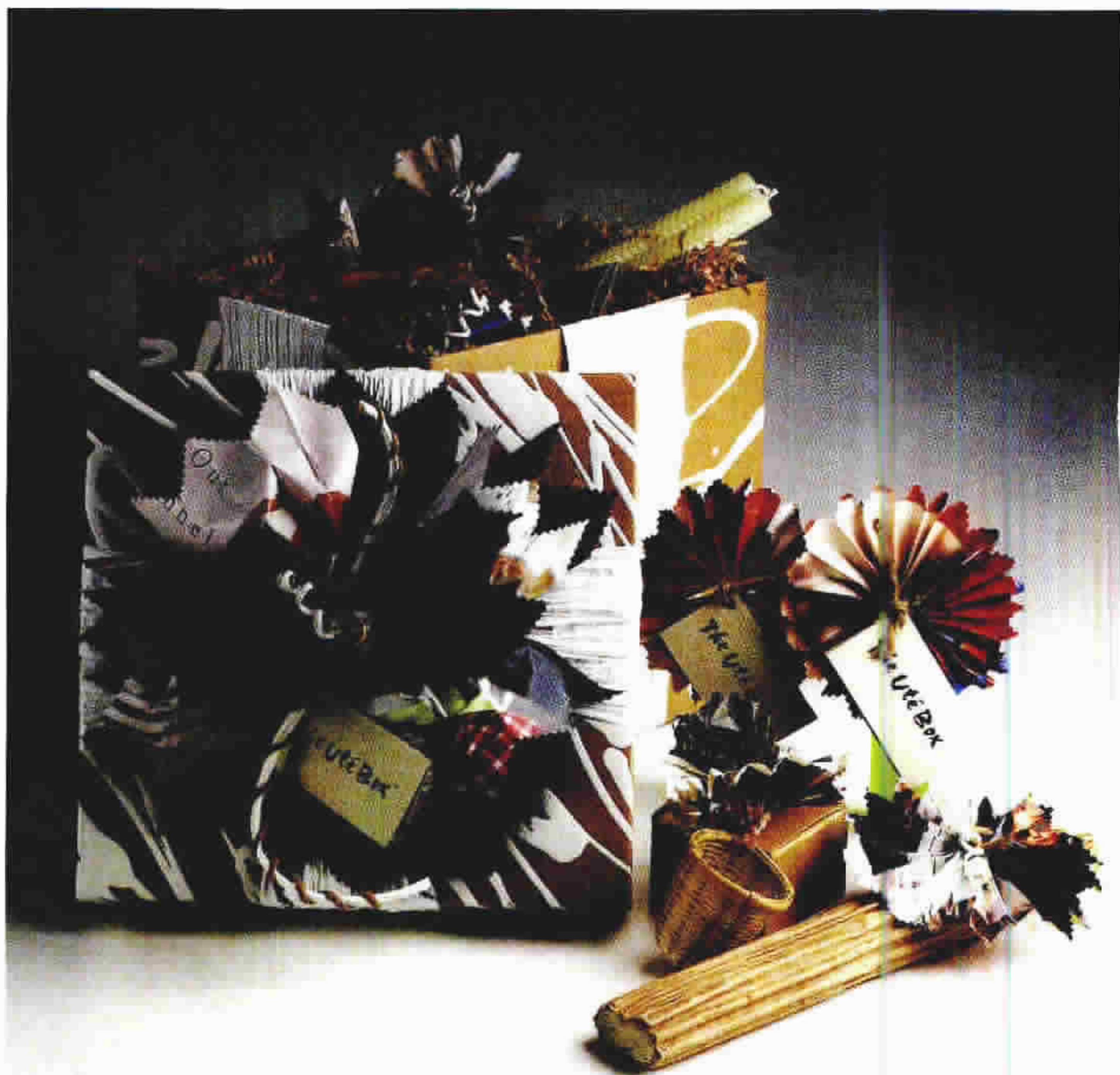
图1-7 女性化妆品的包装似乎应该是细腻、精致、秀美的。而这组手工制的化妆品礼盒却以随意的方式组合，而又不失浪漫的女性特征。值得注意的是，其外盒及里面的包装材料全部由再造或可再造材料做成，体现了当今包装设计对环保和节约能源的重视。