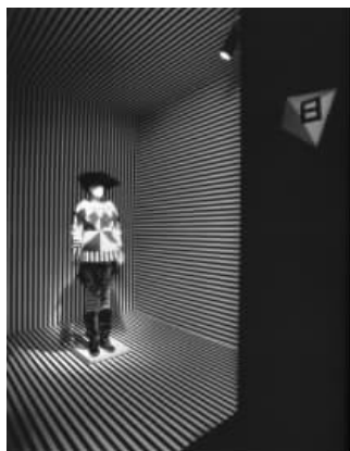
图 1.17 展示空间示样

图 1.16: 大面积的花朵图案作为展览的入口处的广告图形的主体, 传达出展示的主题, 传播出主题馆的内在信息和精神。