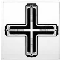
图 1.6 德国馆所用十字形柱

附加的雕刻装饰,然而对建筑材料的颜色、纹理、质地的选择十分精细,搭配异常考究,比例推敲精当,使整个建筑物显出高贵、雅致、生动、鲜亮的品质,向人们展示了历史上前所未有的建筑艺术质量。展馆对20世纪建筑艺术风格产生了广泛影响,也使密斯成为当时世界上最受瞩目的现代建筑师。