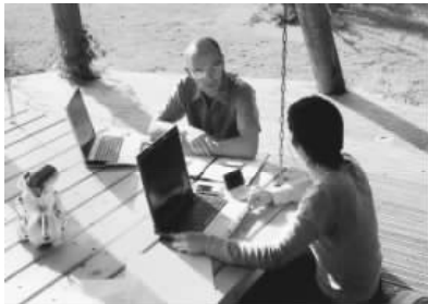
图 1.10 人与环境