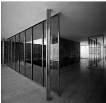
图 1.7 有十字形柱的空间展示