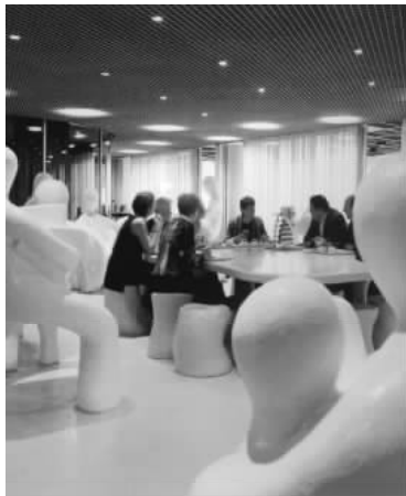
图 1.12 人与环境

图 1.10、图 1.11、图 1.12:人在环境的 4 个层面上处于核心的位置,展示空间是一门综合了人工环境和社会环境的艺术。