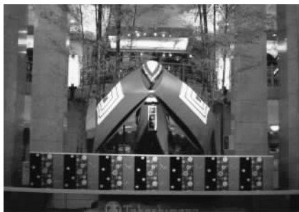
图 1.19 展示空间示样

图 1.18: 带有传统寓言故事情节的橱窗展示设计让人联想起童年许多美好的回忆, 这是企业品牌展示中最有效、最直接的展示手段之一。