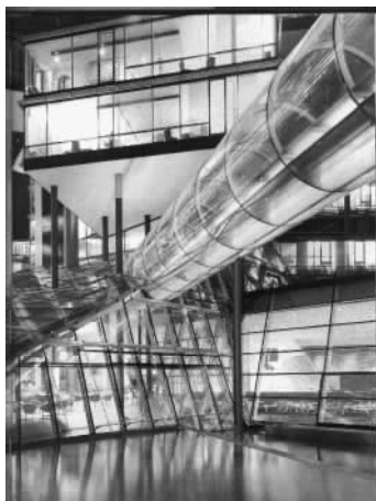
图 1.3 展示空间设计示样

图 1.4 和图 1.5)、“濑户日本馆”及因特网上的“Cyber 日本馆”。“长久手日本馆”是一座用近 3 万株竹子覆盖的木制二层建筑物。政府馆的主题是“日本的经验:从 20 世纪的繁荣到 21 世纪的繁荣将重新连接开始疏远的人类和自然”。