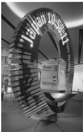
图 1.2 展示空间设计示样