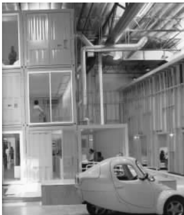
图 1.13 动态(互动式)展示示样

展示艺术是以科学技术和艺术为设计手段,并利用传统的或现代的媒体对展示环境进行系统的策划、创意、设计及实施的过程。随着人类社会的不断进步和人类文化的持续发展,展示艺术在人类经济与文化中的地位愈来愈重要,它既是国际经济贸易相互交流合作的纽带,又是科学技术及文化宣传的窗口,它在当今社会领域、信息领域和商业领域中充当着其他行业或媒体不可替代的角色,世界各国为展示自己国家的科学、经济、文化的发展及成就也是不遗余力,现代商业展示空间实际上就是一个大舞台,各国的人们都争相表演,展示国家发展的魅力,表现民族文化的精彩。现代商业展示空间的手法各种各样,展示形式也多样化,动态展示是现代展示中备受青睐的展示形式,它有别于陈旧的静态展示,采用活动式、操作式、互动式等,观众不但可以触摸展品,操作展品,制作标本和模型,更重要的是可以与展品互动,让观众更加直接地了解产品的功能和特点(见图 1.13,图 1.14 和图 1.15)。