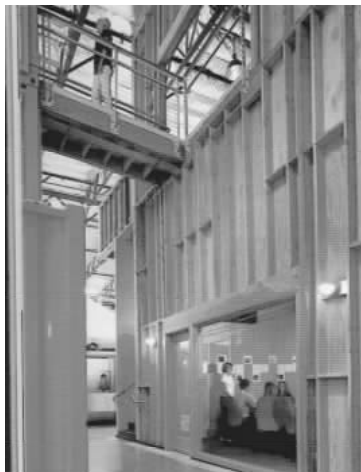
图 1.15 动态(互动式)展示示样

图 1.13、图 1.14、图 1.15:现代商业展示空间的手法各种各样,展示形式也多样化,更直接、更富有感受力,更容易刺激购买行为和消费行为。