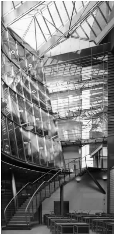
图 1.1 建筑物示样

谈到空间构筑体依据传统的分类是以构筑体使用的时间长短来细分的。通常分为永久性构筑体和临时性构筑体。永久性构筑体,如建筑、纪念性标志构筑物、景观功能构筑物等,其结构材料必须依据非常严格的技术标准,满足各项物理实验指标。标准的制订通常是非常严格的,因为,构筑物本身要在使用时间内保证安全。而展示空间的构筑体在使用周期上相对于永久构筑物的使用