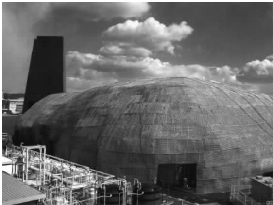
图 1.5 长久手日本馆远景

家”,是 360 度球型全天影像系统。在“地球之家”,参观者可以体验到地球原有的生命力。这座竹子覆盖的建筑物可降低室温,节约空调电力,还采用了降温系统,向屋檐上的光催化剂钢板上放流水,用汽化热降低室内温度。当光照射在二氧化钛上时产生氧化,来分解污秽和细菌的技术,有净化空气、净水、抗菌、防污等各种功能。利用阳光照射涂抹二氧化钛的钢板,使水的表面张力变小,形成薄膜的性质。根据阳光,加速光催化剂钢板上的水的蒸发,夺走周围的汽化热来降低室内温度。馆内的电力全部由太阳光和生物能等新能源系统供给,建筑物内还使用了生物分解性塑料墙壁等。