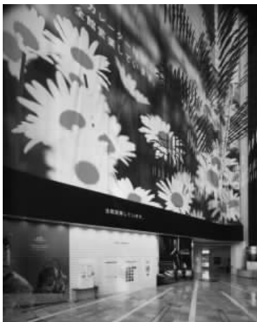
图 1.16 展示空间示样

图 1.16: 大面积的花朵图案作为展览的入口处的广告图形的主体, 传达出展示的主题, 传播出主题馆的内在信息和精神。