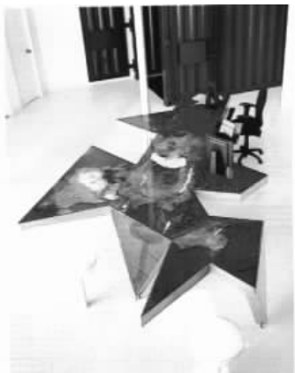
图 1.14 动态(操作式)展示示样