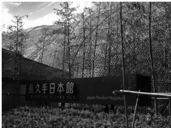
图 1.4 长久手日本馆近景

图 1.4 和图 1.5)、“濑户日本馆”及因特网上的“Cyber 日本馆”。“长久手日本馆”是一座用近 3 万株竹子覆盖的木制二层建筑物。政府馆的主题是“日本的经验:从 20 世纪的繁荣到 21 世纪的繁荣将重新连接开始疏远的人类和自然”。