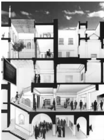
图 1.11 人与环境