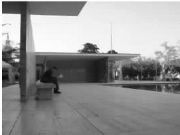
图 1.8 德国馆场景

图 1.6、图 1.7、图 1.8:巴塞罗那国际博览会德国馆的设计向人们展示了历史上前所未有的建筑艺术质量。对20世纪建筑艺术风格产生了广泛影响,建筑本身就是展品主体的思想和理念是展示功能建筑典型的理论基石。