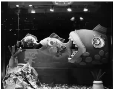
图 1.18 展示空间示样

图 1.17: 通过平行直线性的折弯的走向变化, 构筑的展示空间和所展示的服装品牌相互呼应, 充满了浓郁的欧式风情。