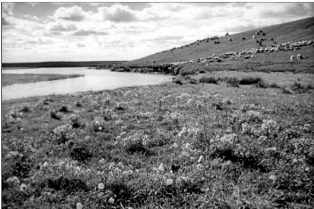
1. 美丽的内蒙古科尔沁草原像一颗宝石，镶嵌在祖国的北方大地上。初春时节，冰雪融化，河水缓缓流淌，滋润着这片沃土。