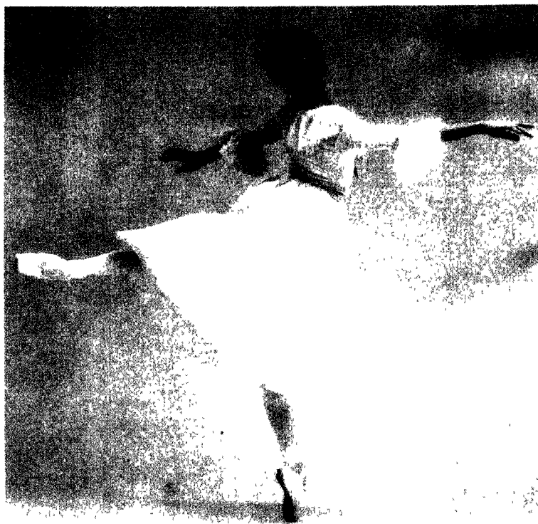
图 11 人体在舞蹈中是多么轻盈、灵巧、优美和不可思议!