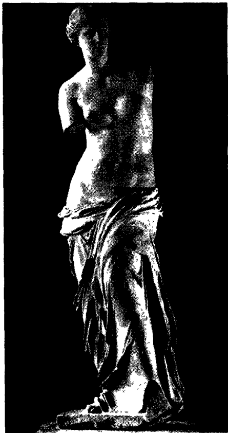
图 5 米罗岛的维纳斯 [希腊]