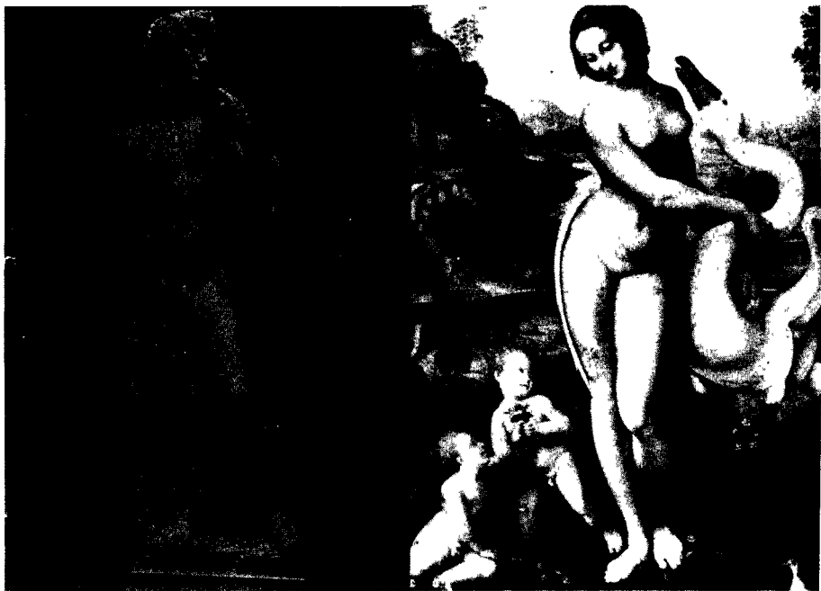
图 9 《大卫》[意]米开朗基罗