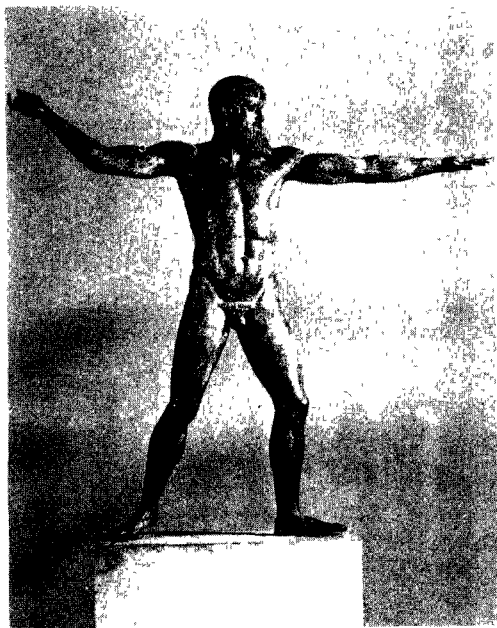
图1 《波塞冬像》(另一说是《宙斯像》)