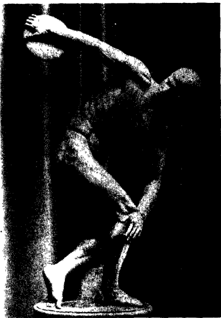
图 6 《掷铁饼者》 [希腊]米隆