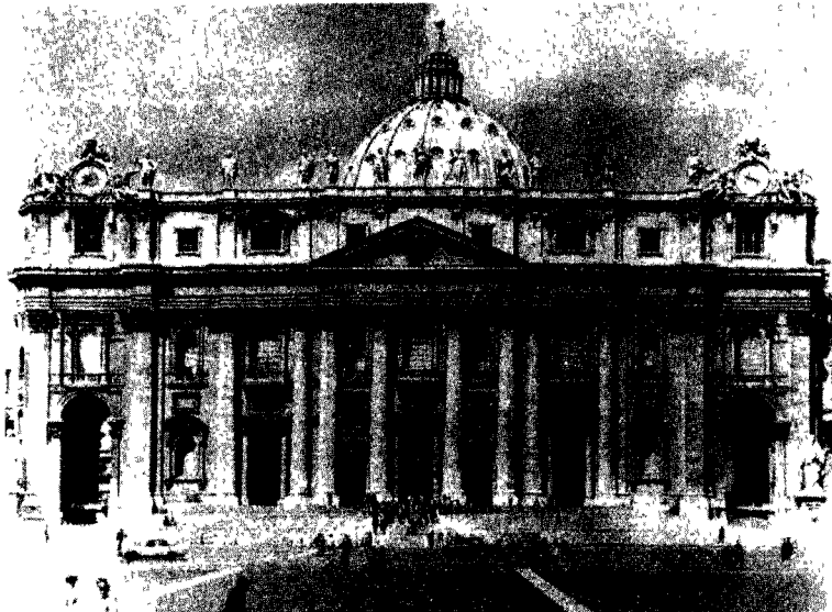
图 10 《罗马圣彼得大教堂》[意]米开朗基罗