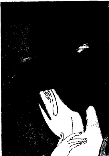
图2 化妆美人 [日]喜多川歌磨