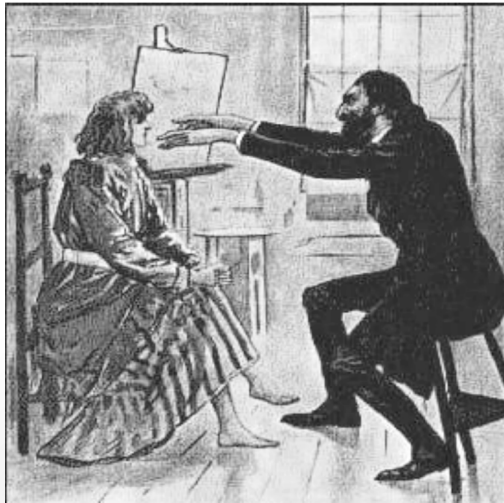
图 1-2 通过语言暗示, 催眠师可以将受术者诱导至深度催眠状态, 这样就可以从潜意识里查找某些非器质性疾病的病因。

台湾的另一位学者刘焜辉认为, 催眠是指当事人接受治疗者所发出的特殊的心理学或生理学之操作, 很容易被暗示, 并且只集中于治疗者给予的暗示, 呈现与平常迥异的特殊意识, 因而容易引起变态心理学上的许多现象, 这种状态称为催眠。催眠心理治疗