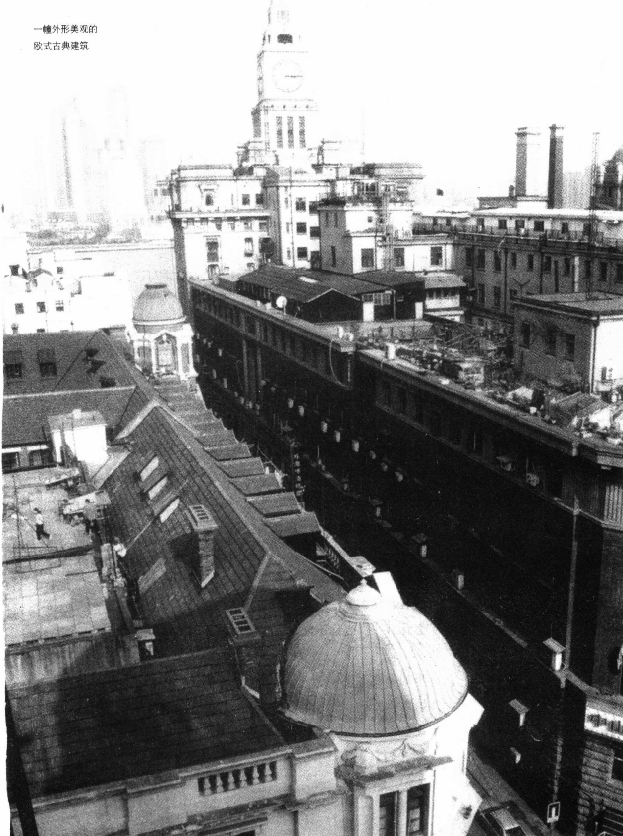
一幢外形美观的 欧式古典建筑