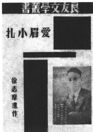
《爱眉小札》徐志摩著，良友文学丛书之一种。

30. 赵家璧《新传统》、31. 郑伯奇《打火机》、32. 沈从文《新与旧》、33. 丁玲《意外集》、34. 王统照《春花》、35. 鲁彦《河边》、36. 杜衡《漩涡里外》、37. 鲁彦《野火》、38. 茅盾《烟云集》、39. 张天翼《在城市里》、40. (缺) 41. 赵家璧译《月亮下去了》、42. 耿济之译《兄弟们》(第一部) 43. 沈从文《从文自传》、44. 茅盾《时间的纪录》。