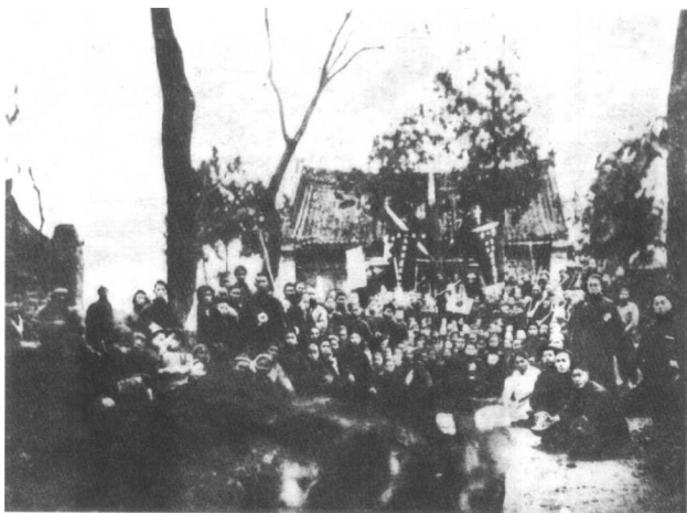
1928年春 刘志丹、谢子长、 唐树等同，志领导 了陕西渭南华县 农民起义，在关 中地区点燃了游 击战争的烽火。 这是起义后成立 农会组织。