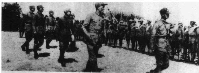
“西安事变”和平解决后 红 驿马关,