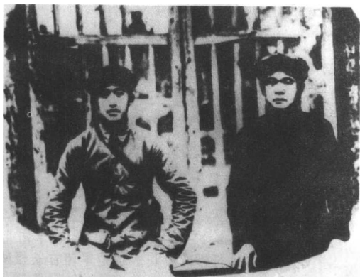
1935年8月，红 军打下了甘肃两 当县。吴焕先与徐海 东（右）合影。这张 照片拍后十几天，红 26军政委吴焕先在 四坡村战斗中牺牲。