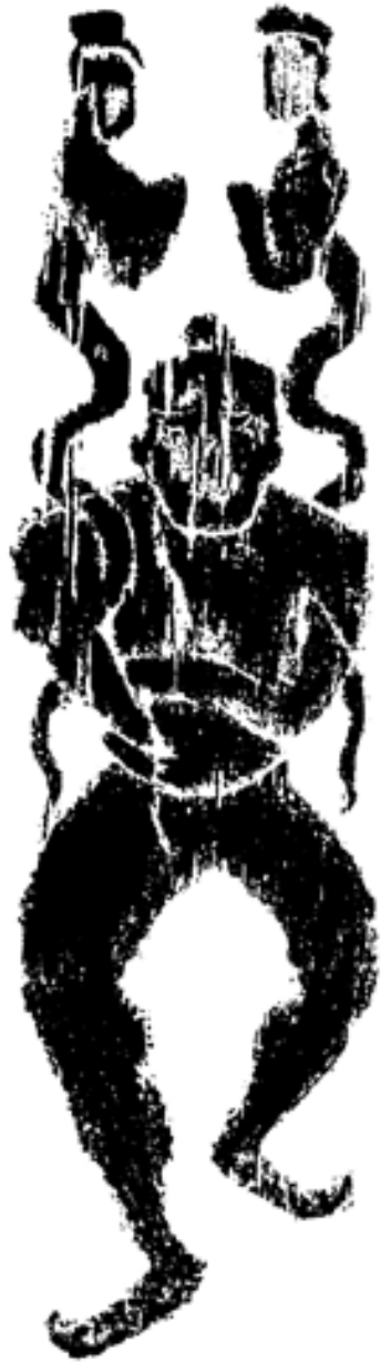
盘古开天辟地画像砖 图左为伏羲，右为女娲。 他们以人首蛇身的形式 出现。伏羲被称作阳帝， 女娲被称为阴帝。这构 成了一幅完整的中国始 祖神话图。

zhè shì xú zhěng de sān wǔ lì jì zhōng suǒ 这 是 徐 整 的 《 三 五 历 记 》 中 所 jì zǎi de yí jiàn shì hòu rén wéi le jì niàn pán gǔ 记 载 的 一 件 事 ， 后 人 为 了 纪 念 盘 古 kāi pì tiān dì de gōng jì jiù bǎ zhè gè gù shì gài 开 辟 天 地 的 功 绩 ， 就 把 这 个 故 事 概 kuò wéi chéng yǔ “ kāi tiān pì dì ” yòng tā lái biǎo 括 为 成 语 “ 开 天 辟 地 ” ， 用 它 来 表 shì yǒu shǐ yǐ lái dì yí cì huò bǐ yù chuàng lì qián 示 有 史 以 来 第 一 次 ， 或 比 喻 创 立 前 suǒ wèi yǒu de wèi dà shì yè 。 所 未 有 的 伟 大 事 业 。