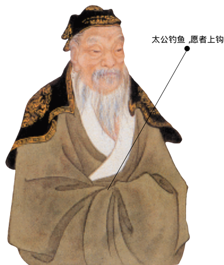
太公钓鱼，愿者上钩