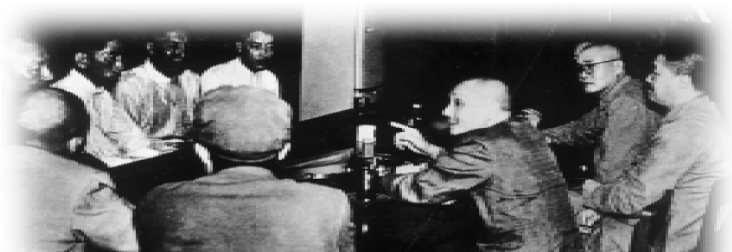
西南军政委员会召开会议，研究解放西藏的问题（右一为刘伯承）。