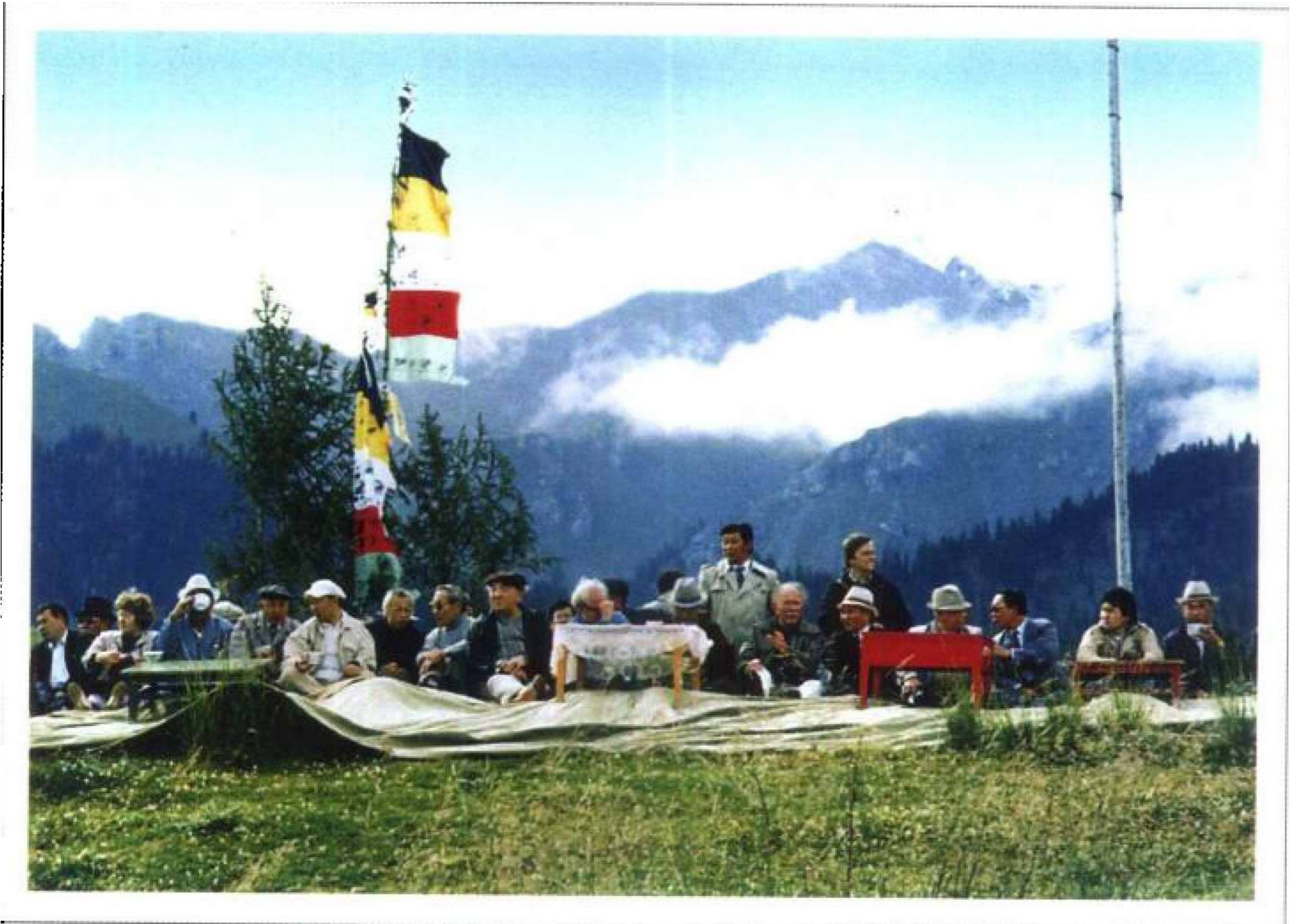
新疆《江格尔》国际学术讨论会于1988年8月在乌鲁木齐市举行。图为出席会议的各国学者在乌苏“江格尔鄂博”祭祀上。