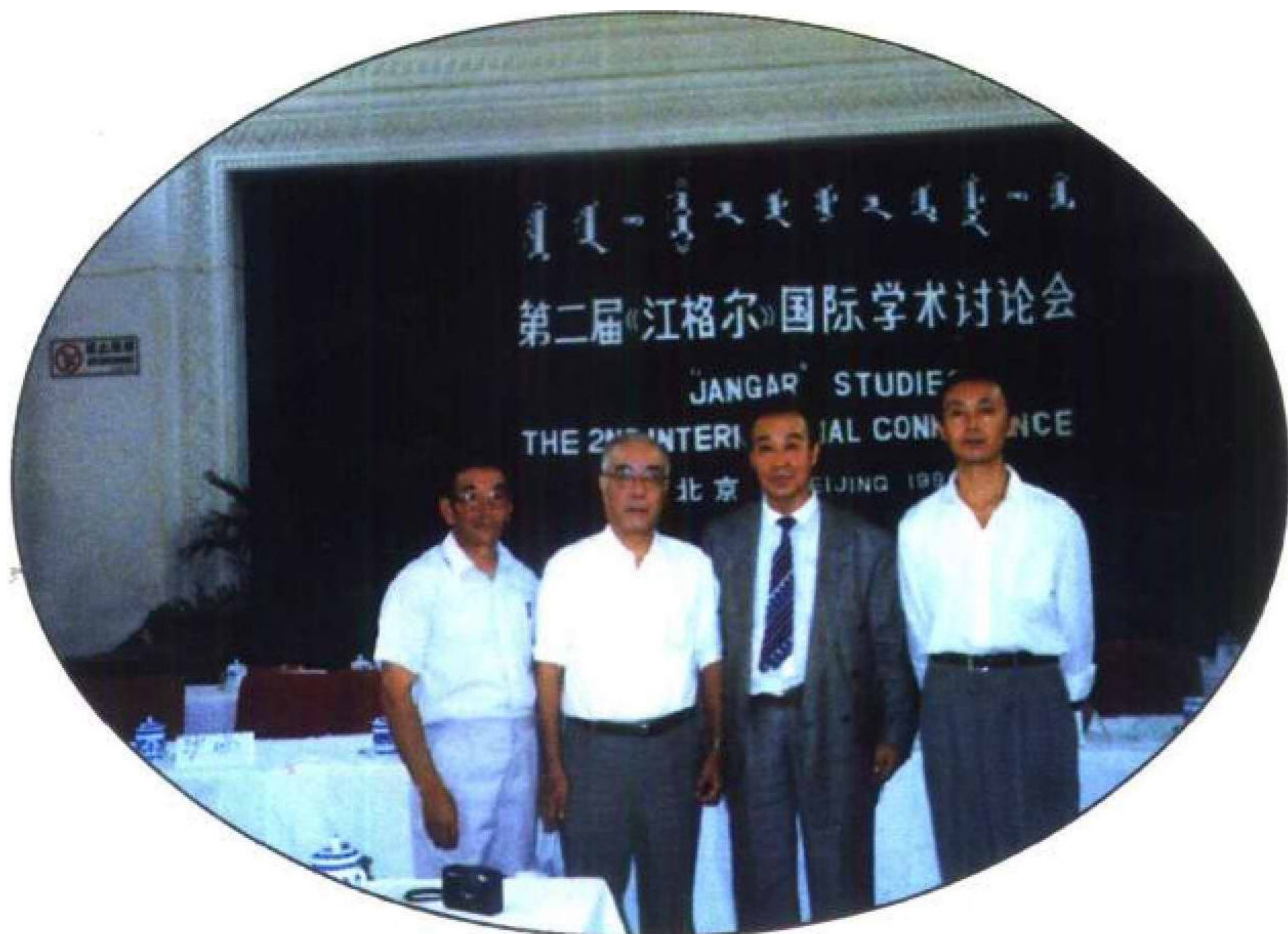
第二届《江格尔》国际学术讨论会于1996年8月在中国北京举行。图为本书作者与出席会议的学者们合影留念。