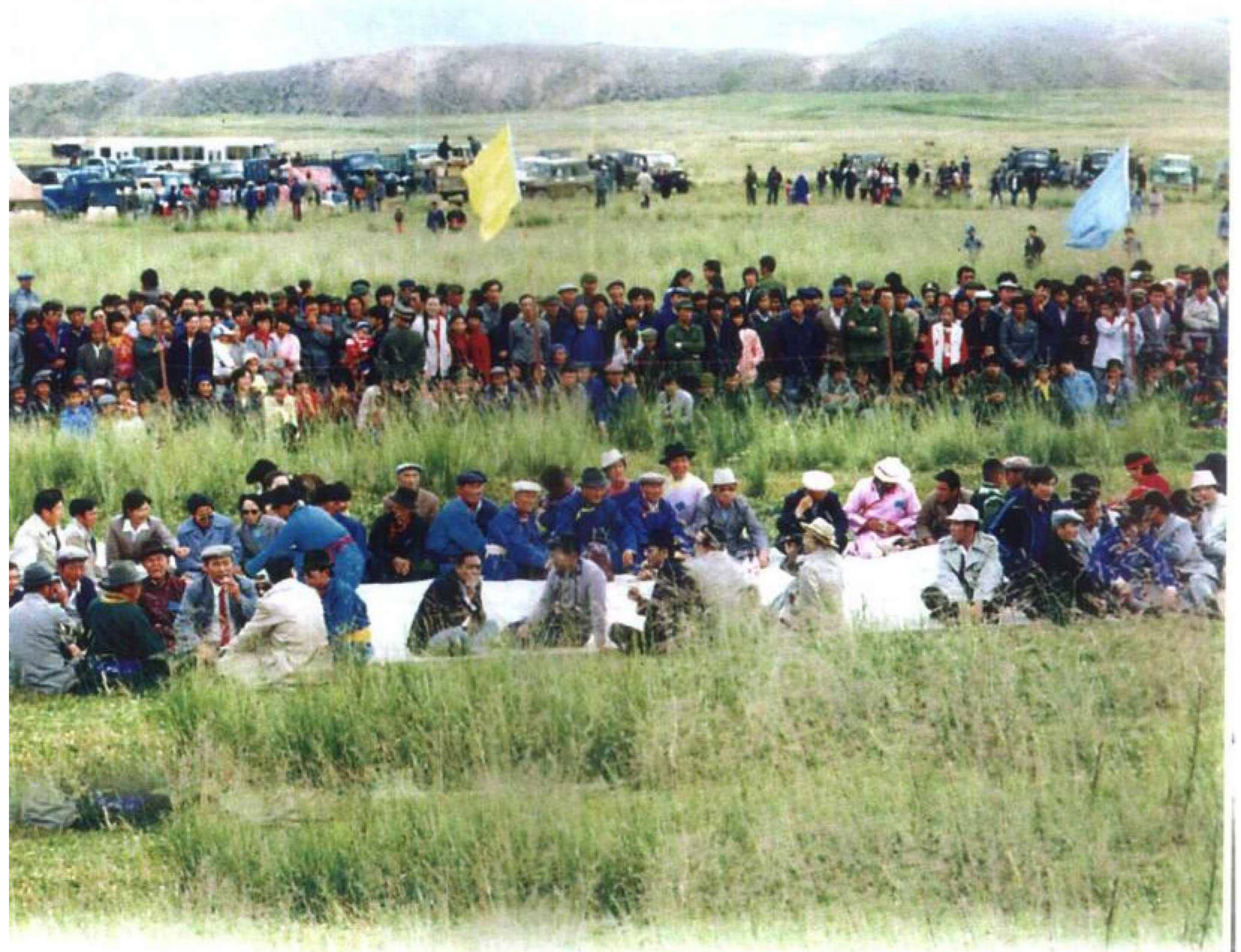
祭祀“江格尔鄂博”，牧民们从四面八方赶来参加，草原沉浸在节日气氛中。