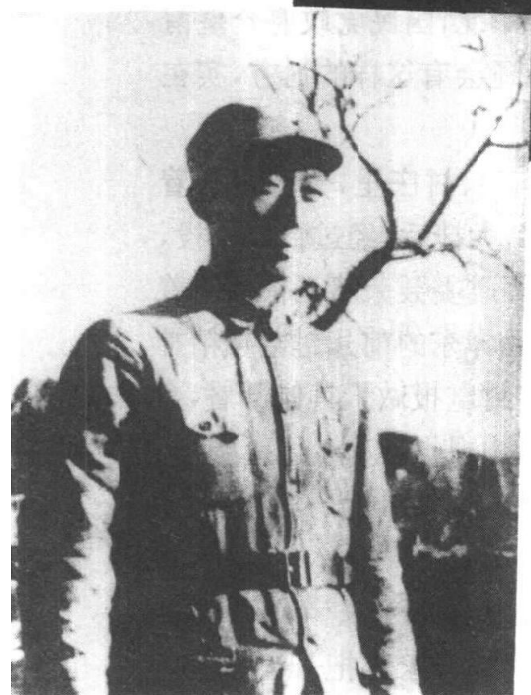
晋察冀军区司令员聂荣臻·