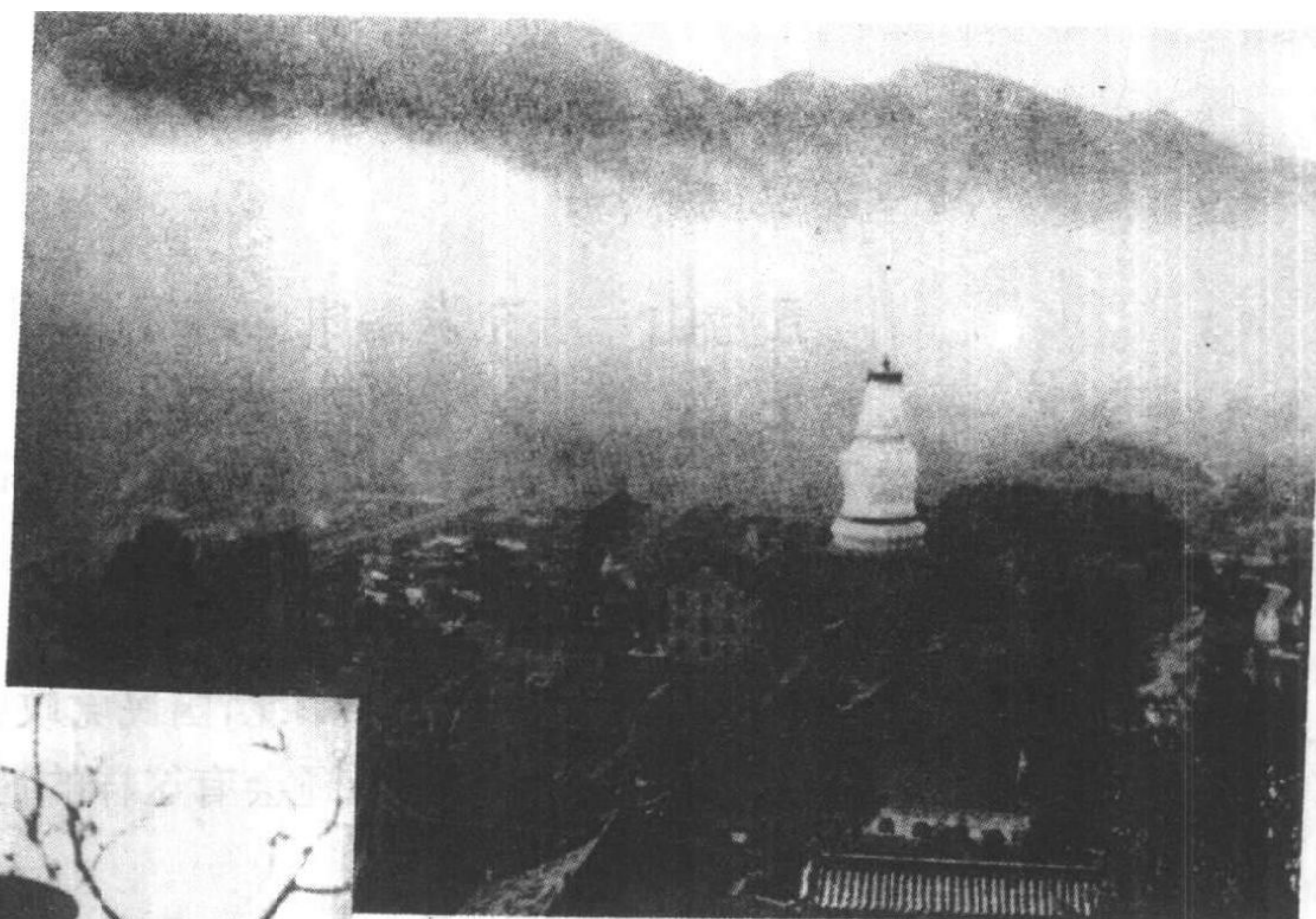
晋察冀边区发源地五台山·