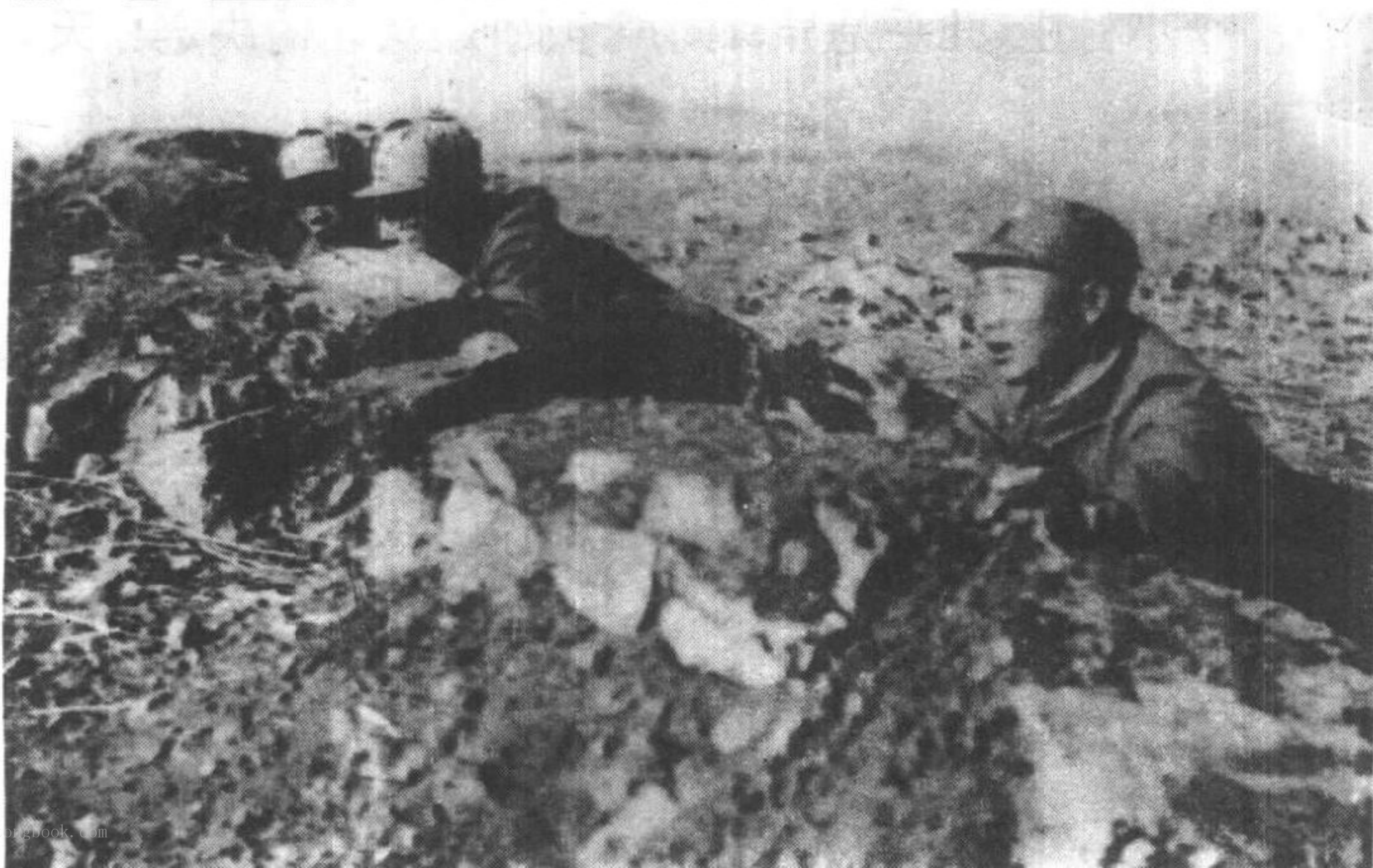
晋察冀一分区司令员杨成武(右)在前线指挥战斗·