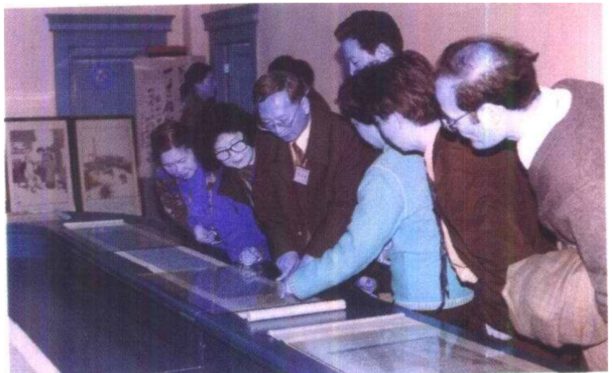
与会学者参观张船山文物