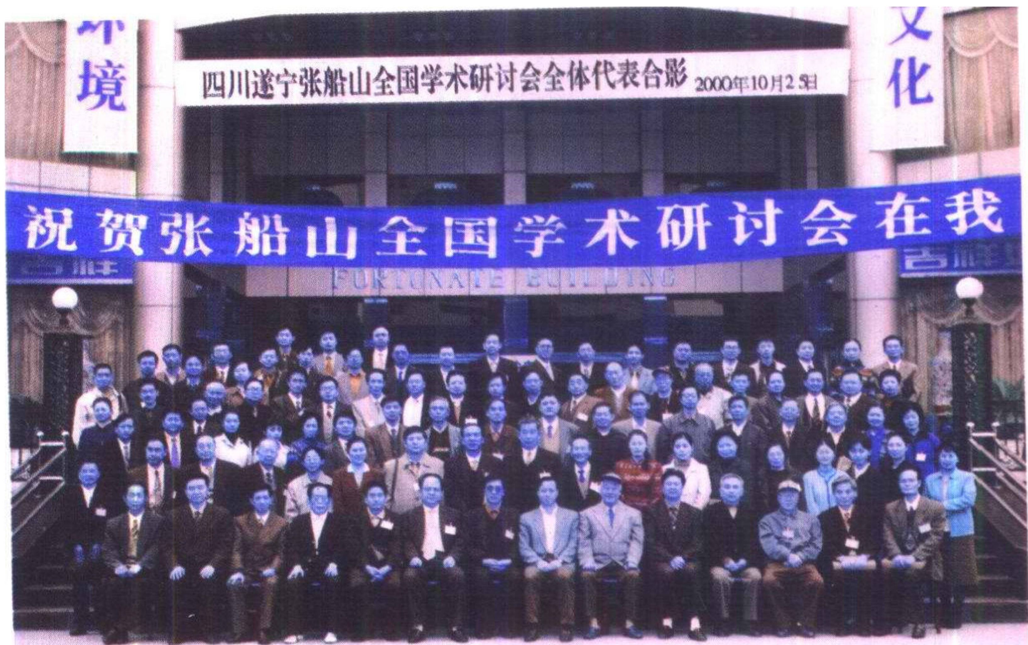
与会全体学者合影