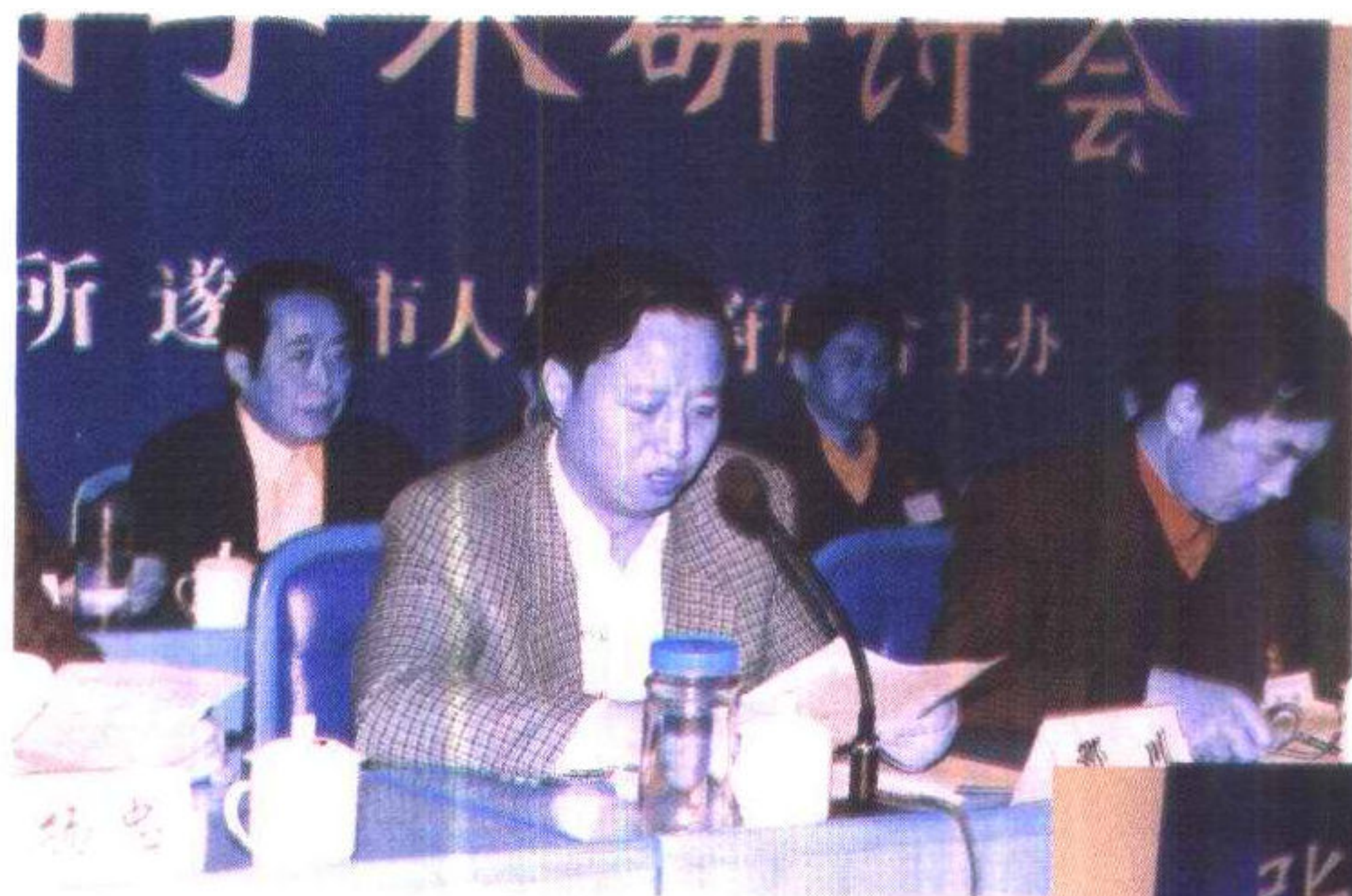
中共遂宁市市委书记邓川致辞