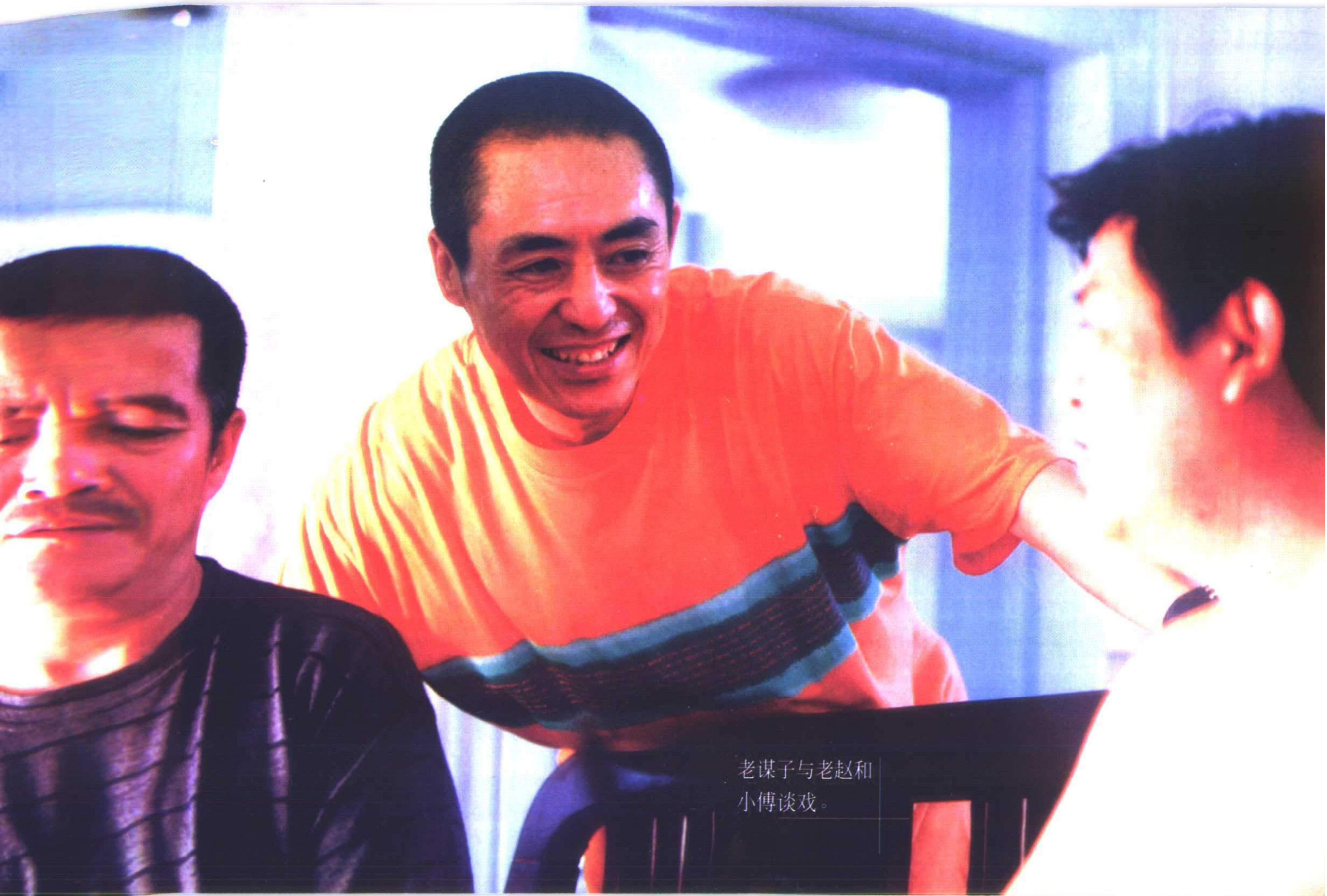
老谋子与老赵和 小傅谈戏。