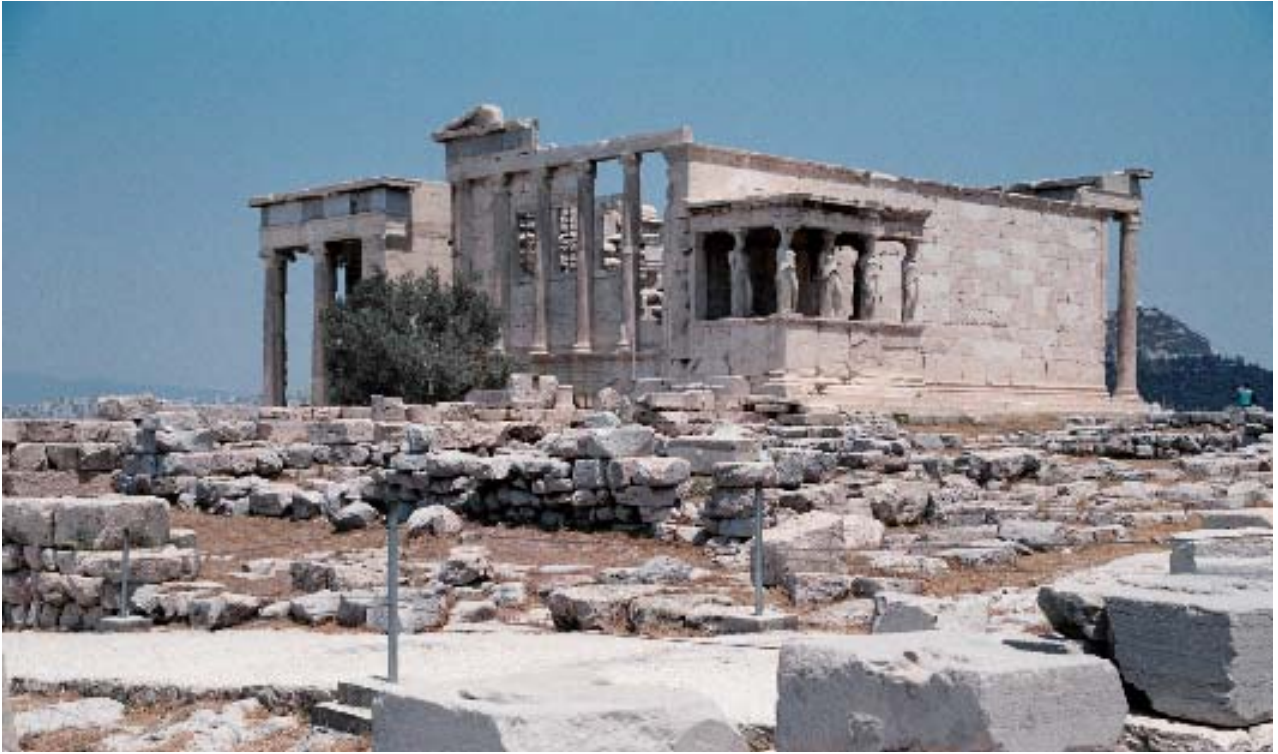
伊瑞克提翁神殿的美丽与孤寂