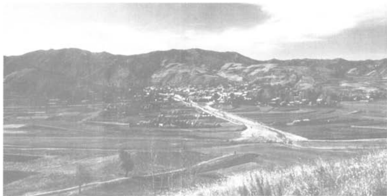
幽深寂寞土岭村（出生地）

在山缝间，显得荒凉寂寞，凄楚幽深。远处，静静的山坳里，几头懒散的黄牛，用那镰刀似的舌头，割卷着青草，享受着进餐的美味。忽而幽远的铃铛声从山涧传出，寻声望去，只见白云似的羊群从山腰漫过，转瞬，又飘上那高高的山冈去，浮在了湛蓝的天际……袅袅的炊烟从山中升起，笼罩在小村的上空，又渐渐地弥漫开来，轻轻地、慵懒地卧在那寂寞幽深的山沟里。一条灰白色的羊肠小道蛇一般从村中窜出，一路扭动着身躯，曲曲折折，忽隐忽现，终于爬上东边那架苍茫的大山，悄无声息地钻入那遥远的未知世界。如泣如诉的大峪河从村边蜿蜒而过，冲破大山那重重阻力，奔向远方；诉说着恒山儿女的悲欢离合，传告着塞北大地的沧桑巨变