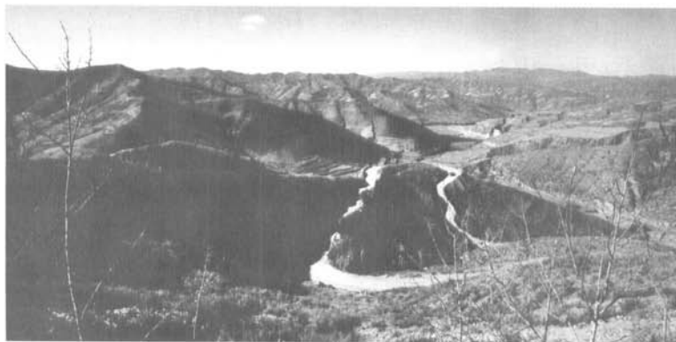
山峦起伏 道路崎岖

因为是深山老林，人烟稀少，所以山村总是空荡荡的；间或有几粒人影丢在空旷的山沟里，劳作着，挣扎着，显得渺小而无助，寂寞而孤独。细雨迷濛中，山桃树染了粉，燕子擦地而过；赶头老牛，慢慢悠悠将那嵌挂在山坡上、瘦小瘠薄的土地一块块仔细耕耘；然后，怀了丰收的渴望，一把汗两脚泥地一片片逐个下种；土地因此被梳理得顺畅匀婷，