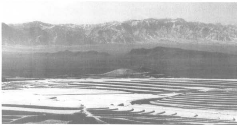
南天屏障——恒山山脉

雄伟壮阔的恒山山脉，自太行而来，浩浩荡荡，莽莽苍苍，涌峰百座，壁立千仞，延绵数百里，其势不可敌；到得塞北高原，正乃南天屏障，牢牢地守护着这片神奇的土地。