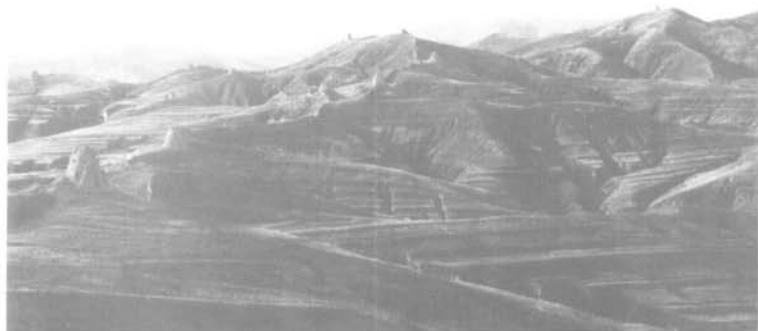
北门锁钥——万里长城

而巍峨壮丽的万里长城，犹如一条飞腾的巨龙，从渤海一跃而起，蜿蜒曲折，起伏跌宕，飞架万余里，其魄无可匹；到得塞北高原，恰似北门锁钥，紧紧地锁控了这片不朽的疆域。