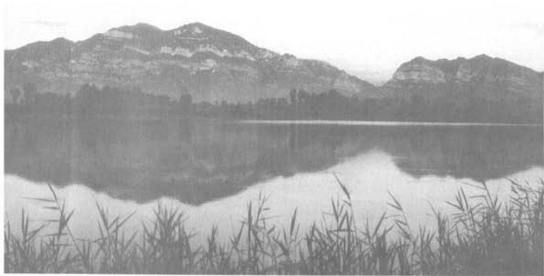
高耸云天的北岳恒山

大山不仅姿态万千，而且情态各异。严冬时分，朔风怒吼，大雪飞扬，千里冰封，万里雪凝，极目之处，唯余茫茫。此时，大山便换了冬装：银妆素裹，淡雅端庄，亭亭玉立，楚楚动人。——俨然净土一片。春光明媚时节，山便脱去它那沉重的冬装，换了鲜花点缀的衣裳，在灿烂阳光下，嫣然薄施脂粉、淡扫娥眉的少妇：窈窕秀丽，婀娜多姿。倘若风雨欲来之际，山呼水啸，电闪雷鸣，继而大雨倾盆，山洪咆哮，狂奔着、怒吼着，将一切污泥浊水、腐朽陈迹，统统涤荡尽净：气吞江河，力撼山岳。——这，便是大山的性格；塞北人的形象。